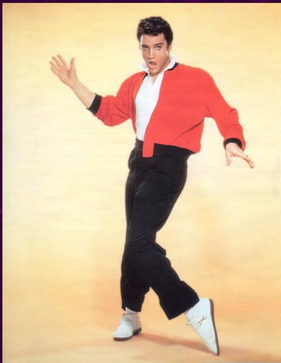
Элвис Пресли. Jailhouse rock.