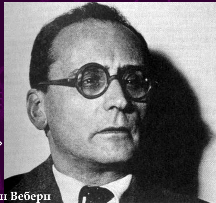
Антон фон Веберн

Содружество Шенберга и его учеников – Альбана Берга и Антона фон Веберна вошло в историю музыки под названием новой венской школы. В основе созданного Шенбергом метода музыкальной композиции лежал принцип додекафонии – последовательности из 12 равноправных и неповторяющихся звуков. Произведения додекафонической музыки нарушало традиционное представление о ладе и гармонии.