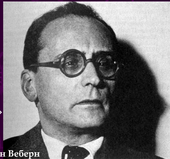
Антон фон Веберн

Содружество Шенберга и его учеников – Альбана Берга и Антона фон Веберна вошло в историю музыки под названием новой венской школы. В основе созданного Шенбергом метода музыкальной композиции лежал принцип додекафонии – последовательности из 12 равноправных и неповторяющихся звуков. Произведения додекафонической музыки нарушало традиционное представление о ладе и гармонии.