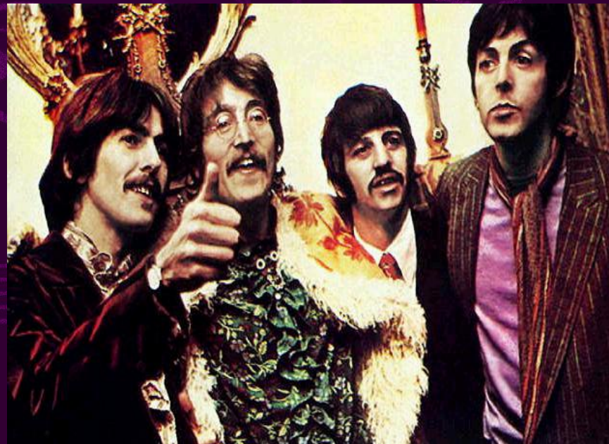
Группа «Битлз»: Джордж Харрисон, Джон Леннон, Ринго Старр, Пол Маккартни.

Появление в 1962 году четверки «Битла» из английского города Ливерпуль стало подлинной сенсацией на музыкальном Олимпе. На целое десятилетие эта группа стала законодательницей рок-музыки. За их произведениями прочно закрепилась репутация серьезного искусства.