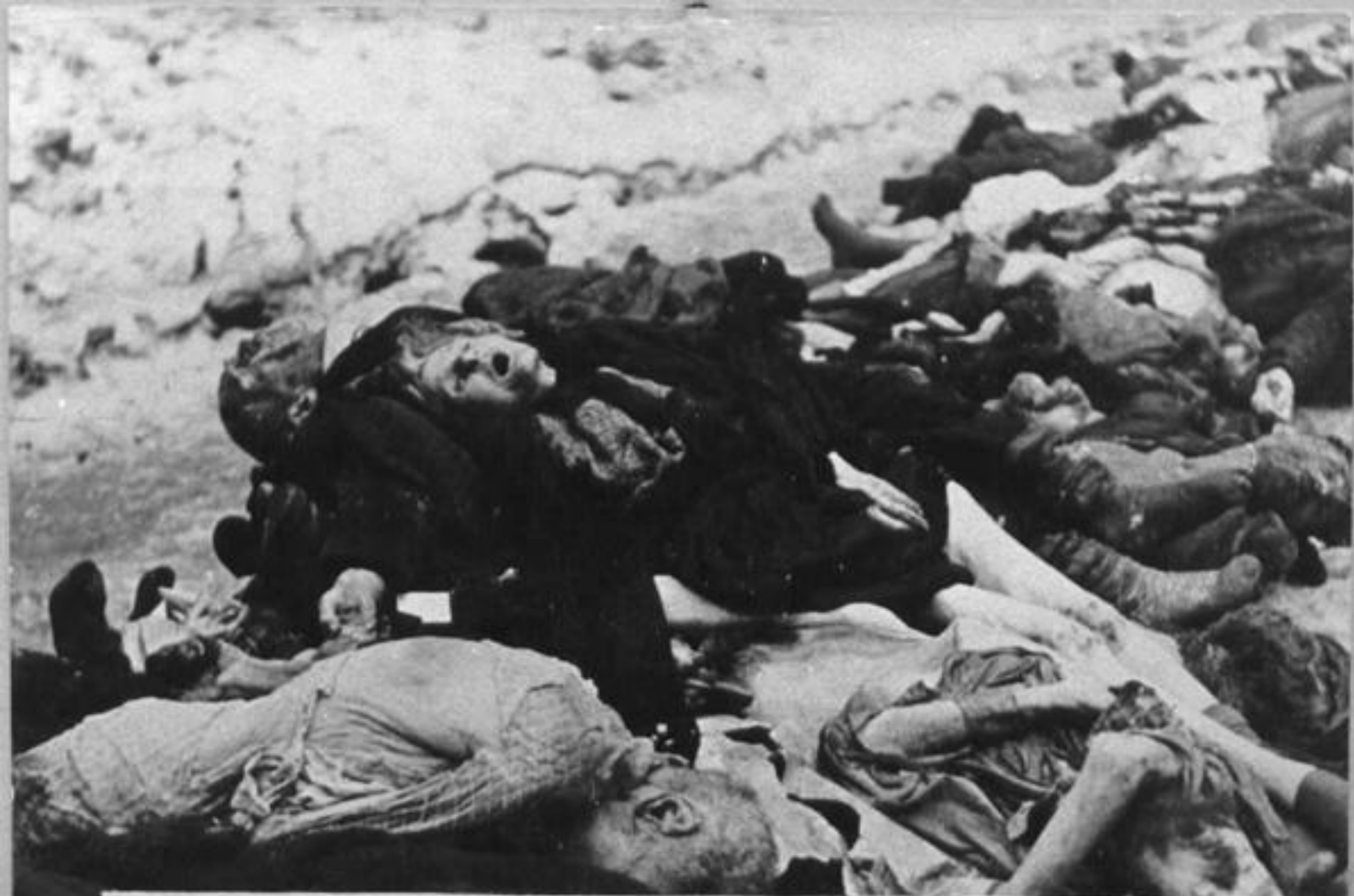
Nyilas áldozatok, zsidó hullatömegek. Opfer der Pfeilkreuzler, Massen von jüdischen Leichen.