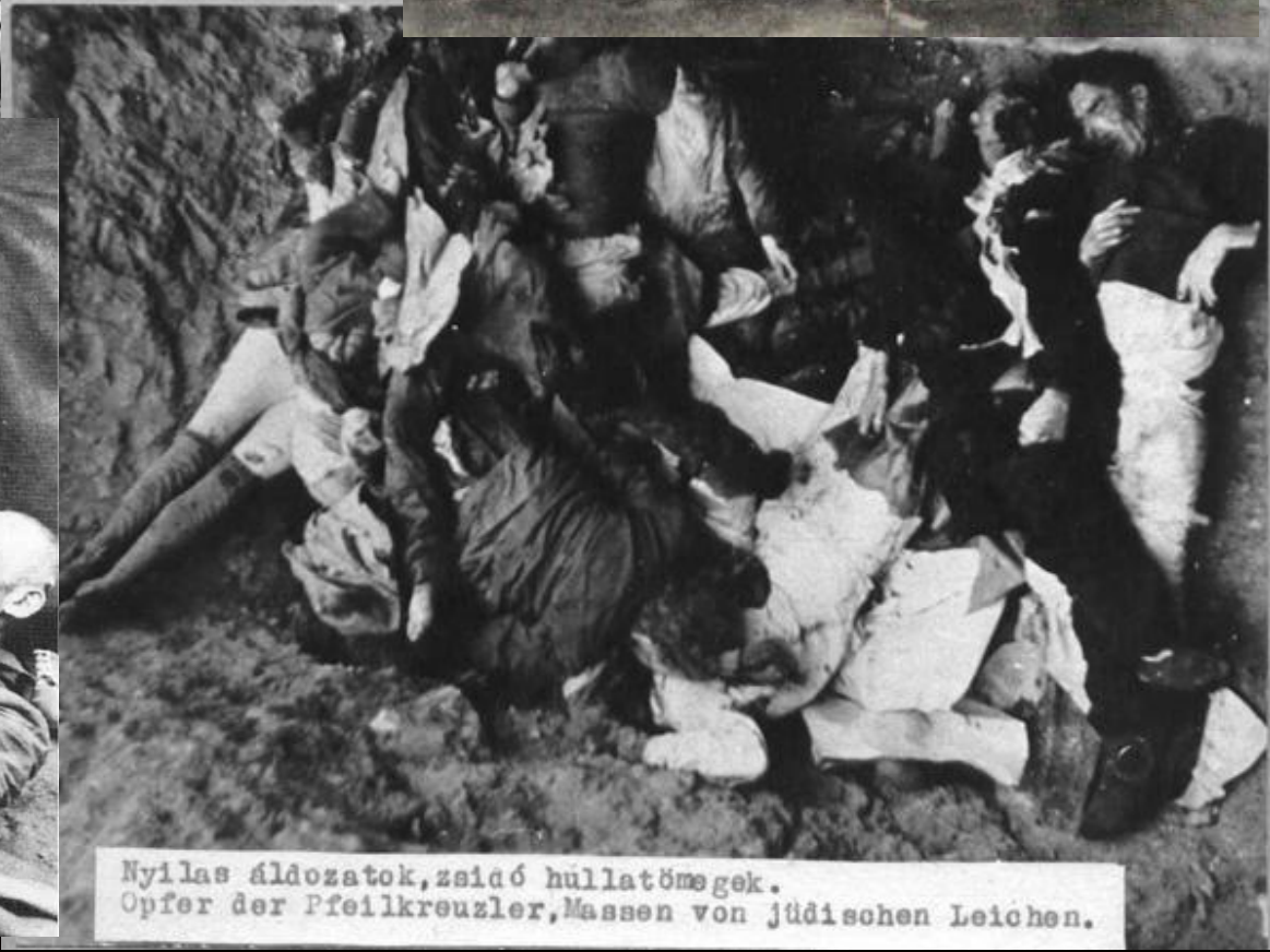
Nyilas áldozatok, zsidó hullatömegek. Opfer der Pfeilkreuzler, Massen von jüdischen Leichen.