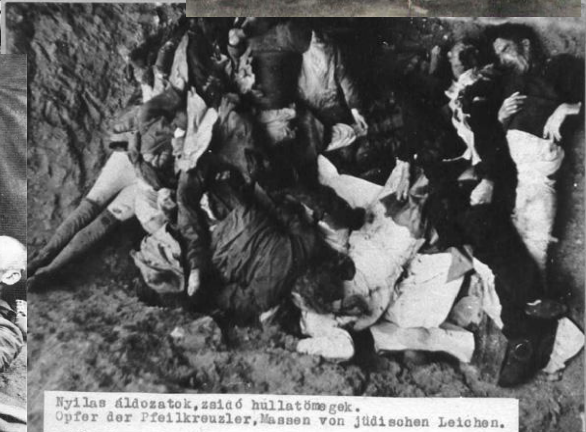
Nyilas áldozatok, zsidó hullatömegek. Opfer der Pfeilkreuzler, Massen von jüdischen Leichen.