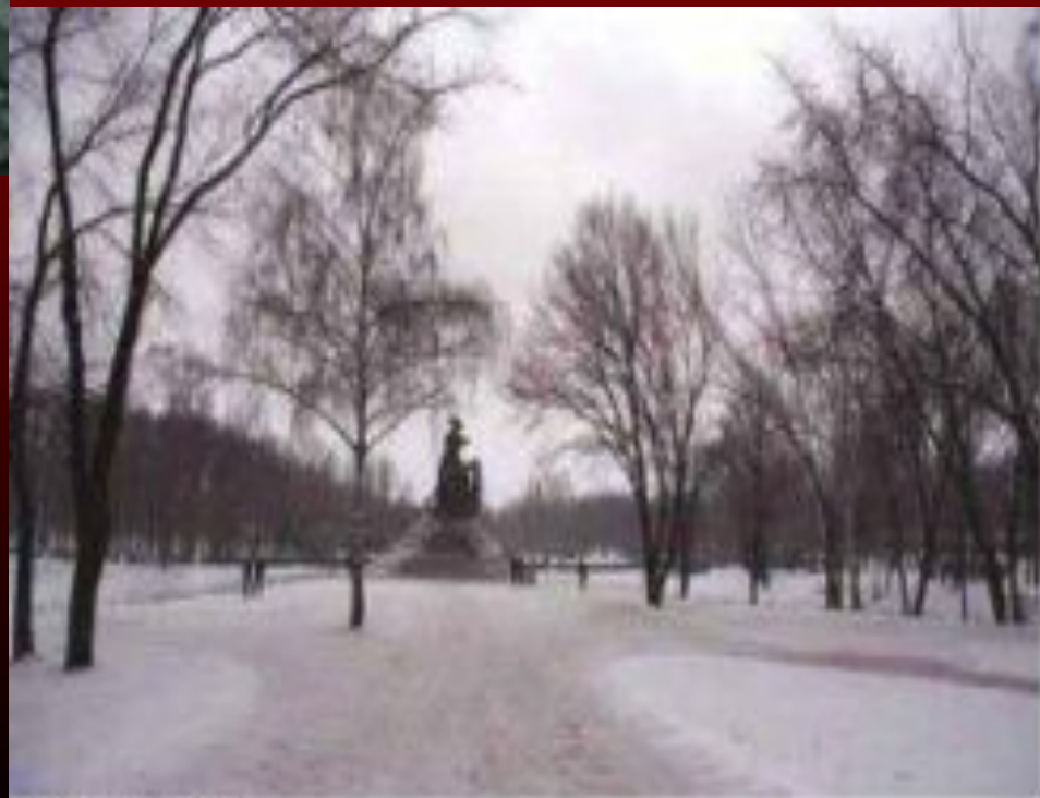
Визуализация в библиотеке