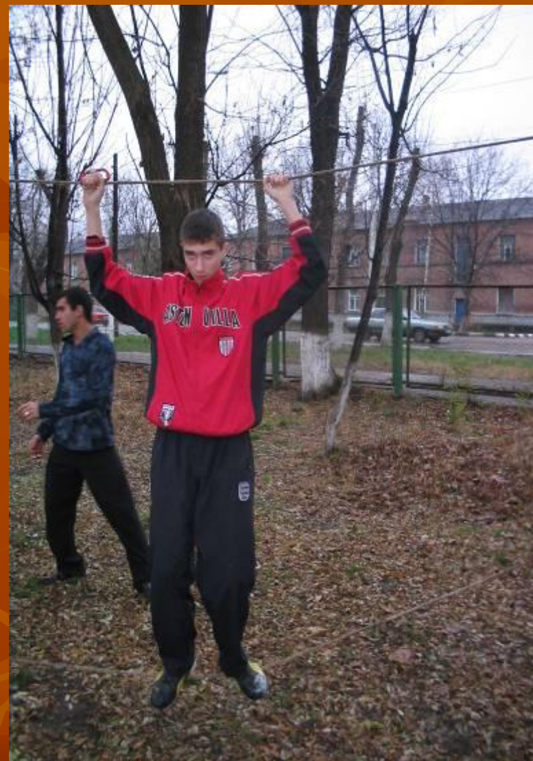
Натяжение переправы: учебное занятие