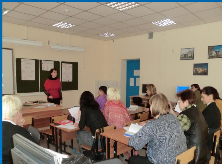
Работа творческой группы