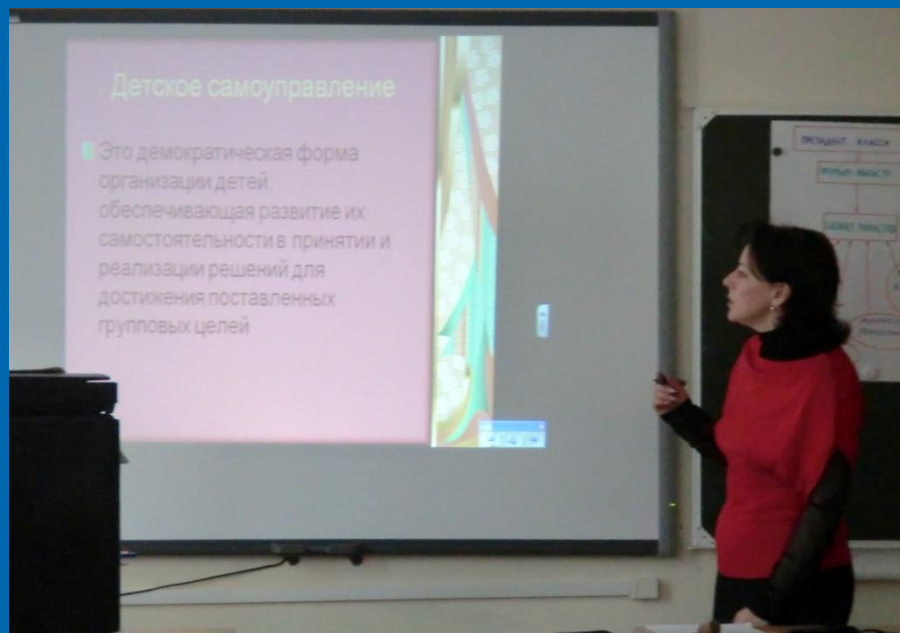
Выступление руководителя МО