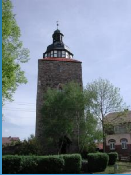
Мышиная башня Mäuseturm