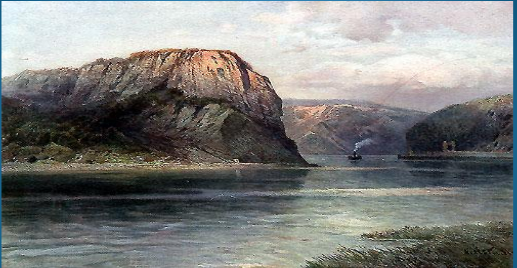
Die engste Stelle des Rheins.