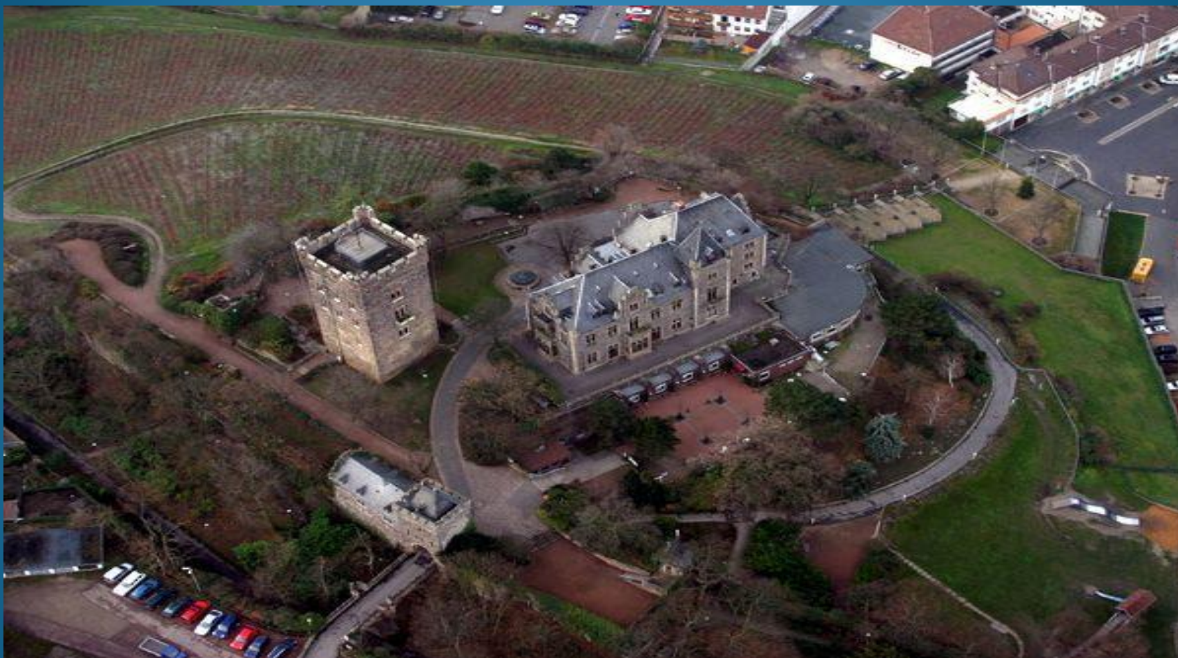
Замок Клопп в Бингене.