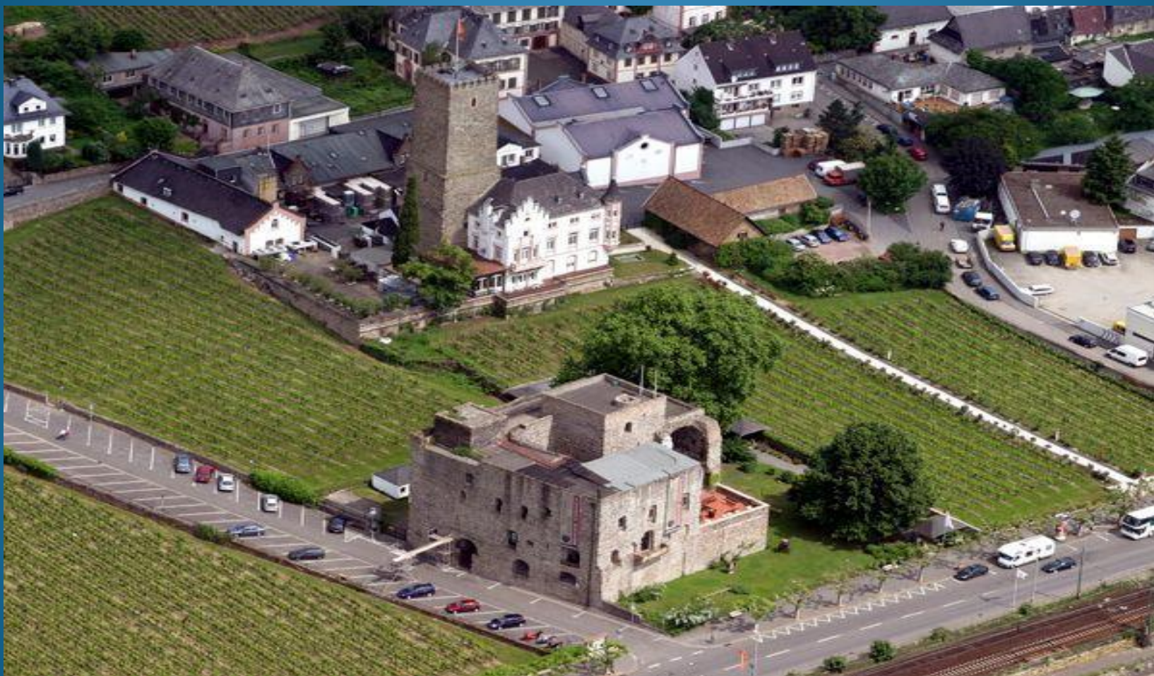
Замок Брёмсербург в Рюдесхайме.