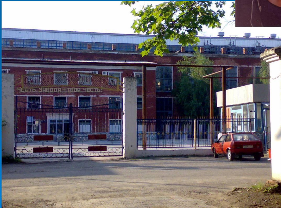
Проходная сахарного завода