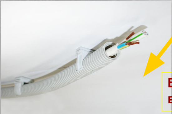
Возможность вертикального монтажа