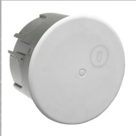
PE 030 030R Коробка разветвительная круглая с усиленным корпусом.