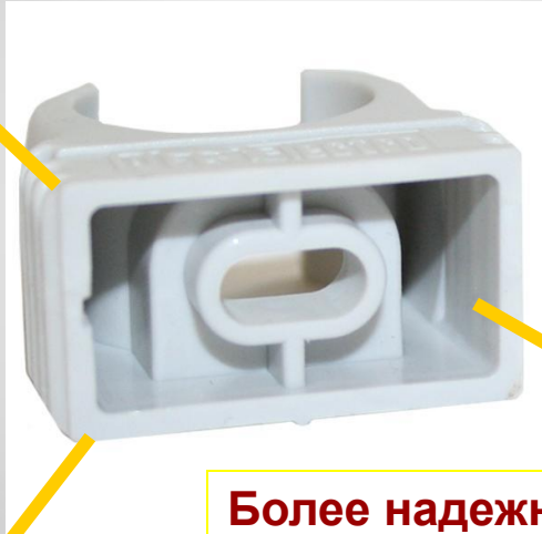
Более надежная фиксация гофротрубы