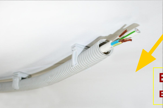
Возможность вертикального монтажа