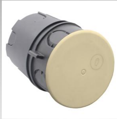
PE 030 030R Коробка разветвительная круглая для углубленного монтажа.