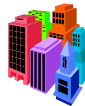
Предприятия атомной отрасли