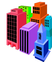
Предприятия атомной отрасли