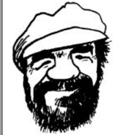
Олег Григорьев. Дружеский шарж А.Каминского

«Друзья юности Олега Григорьева рассказывали, что он не хотел взрослеть. Был он невысок, моложав, тонкой кости и долгое время говорил, что ему семнадцать лет. Мы познакомились, когда ему уже перевалило за сорок. Он был бородат, испит, болен, но на трезвую голову неожиданно превращался в ребенка, с простодушным удивлением и радостью открывавшего знакомый мир» (М. Яснов).