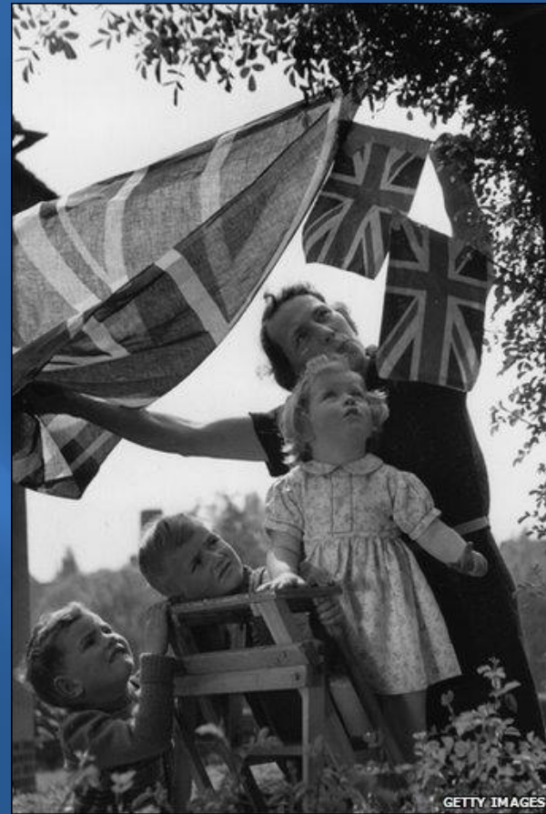
Лондон. 8 мая 1945 год.