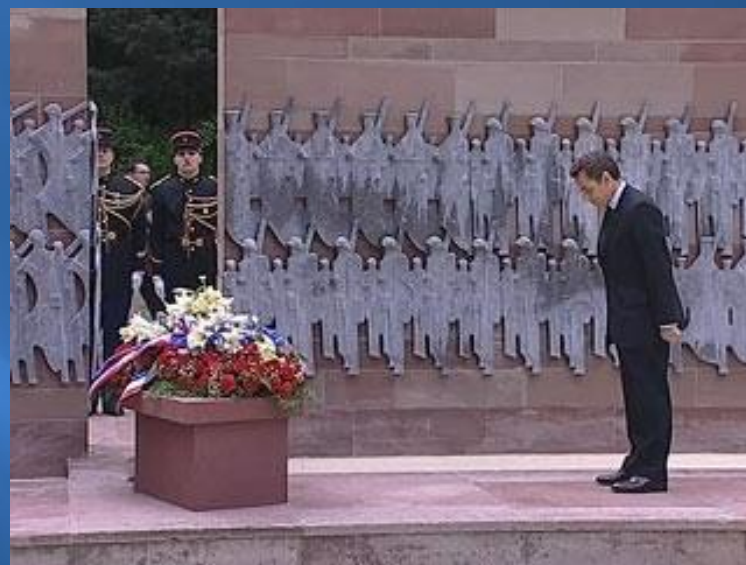
День Победы в Париже