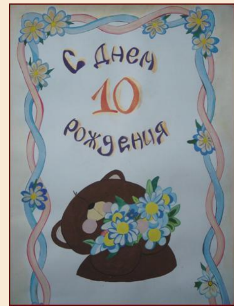
Плакат, посвященный 10-летию ФМО, подготовленный студентами кафедры

Однако многое еще предстоит сделать. К примеру, уже разрабатывается макет специализированной газеты кафедры, где будут отражаться самые последние туристские новости, изменения в нормативно-правовой базе туризма, туристская жизнь факультета в целом. К делу создания газеты планируется подключить студентов, преподавателей и ведущие туристские фирмы столицы и республики.