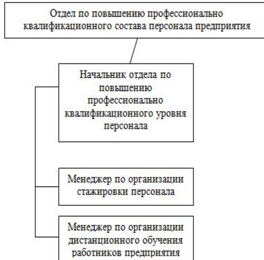
Рис. 2 Структура отдела по повышению профессионально квалификационного состава персонала предприятия СПК «Береговой»