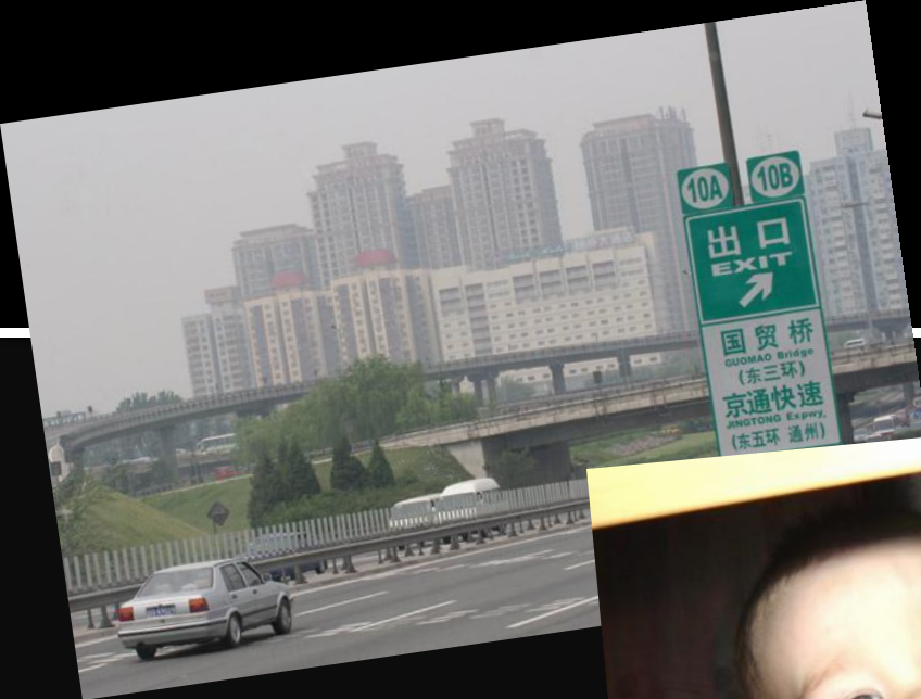
Китай, Пекин 5 утра