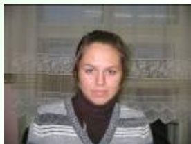
Форейтор Е. (11 А)