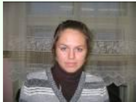
Форейтор Е. (11 А)