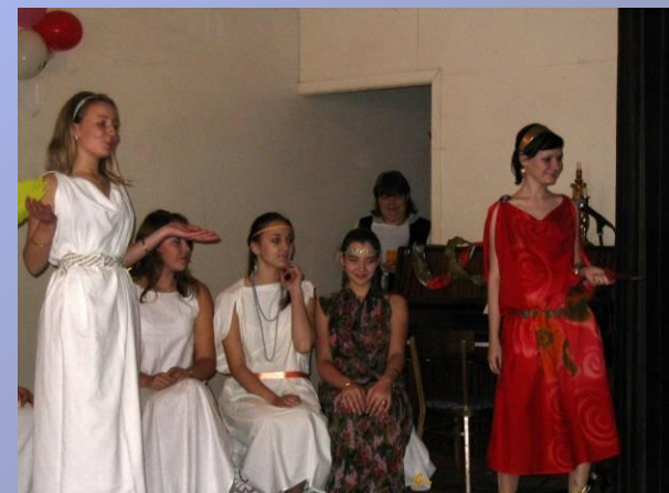
Посвящение в лицейсты