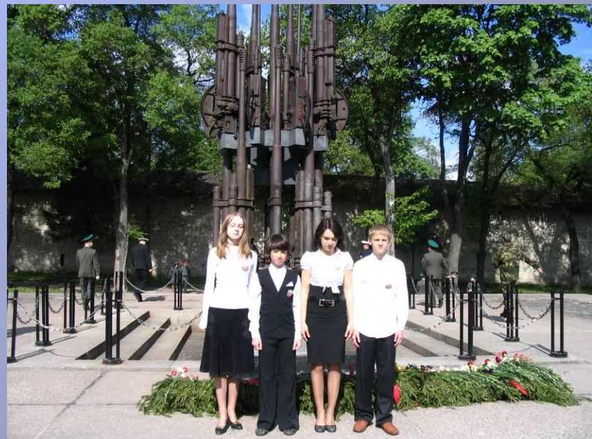
Участие в праздничных мероприятиях