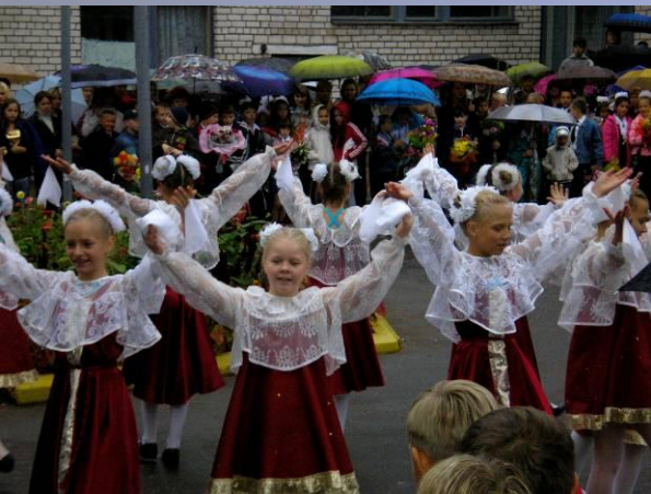
1 сентября 2007