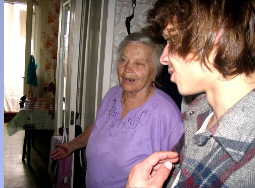
День пожилого человека