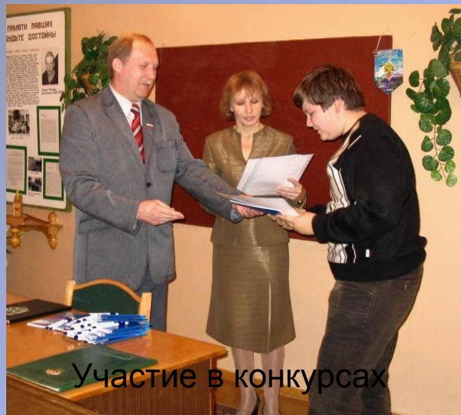
Участие в конкурсах МОУ ПТПЛ, 2008