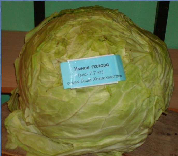
Умная голова (вес - 7,7 кг) семья Саши Хазиахметова