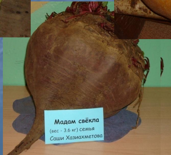
Мадам свёкла (вес - 3,6 кг) семья Саши Хазиахметова