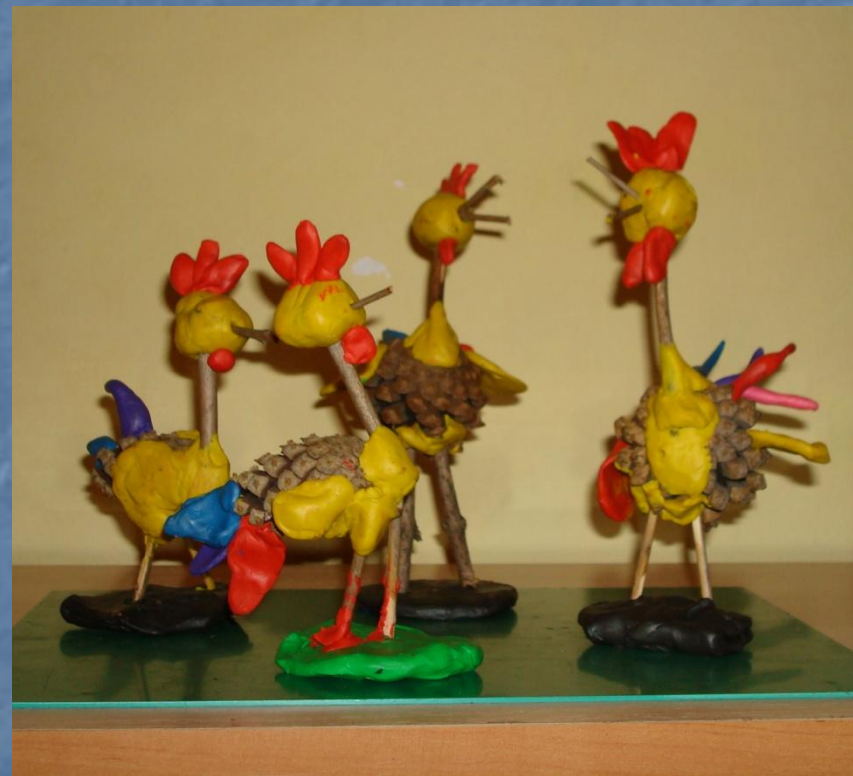
Петушки на прогулке дети средней группы «Смешарики»