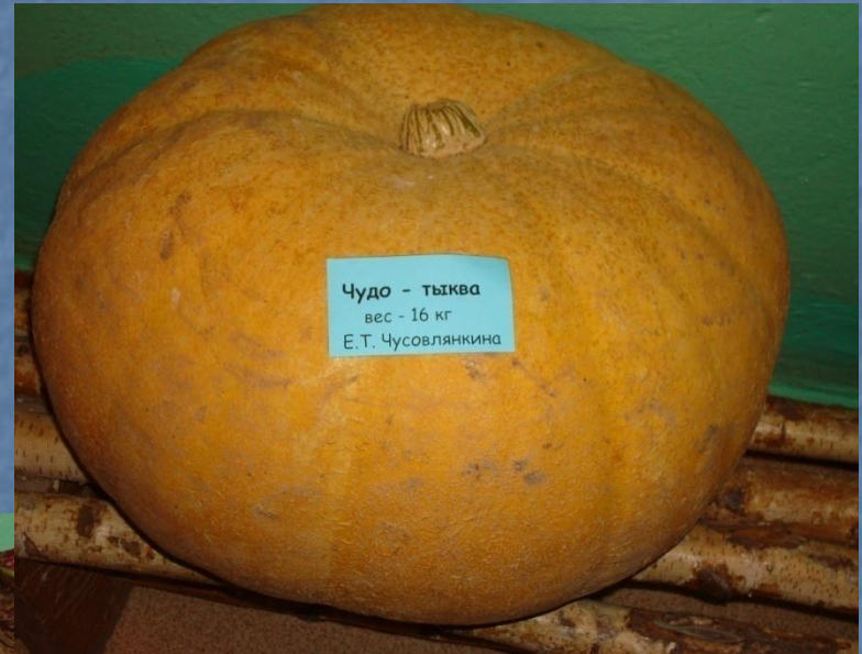
Чудо - тыква вес - 16 кг Е.Т. Чусовлянкина