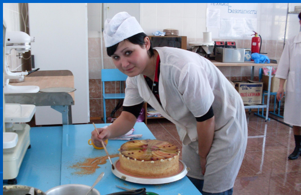
За приготовлением диетического торта