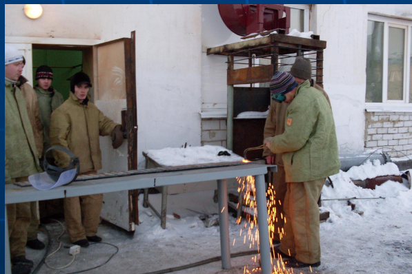
Выполнение пробных работ