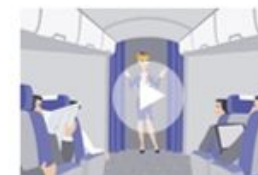
Персональная поддержка — каждому пользователю