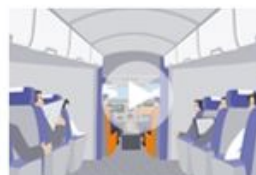
Удобный и точный поиск