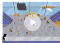
Информация, которой можно доверять