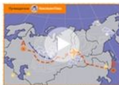
Быстрое решение задач любой сложности