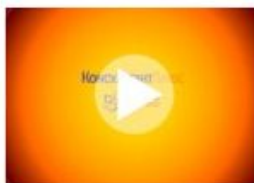
КонсультантПлюс Технология ПРОФ 2012