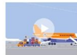
Самая полная правовая база