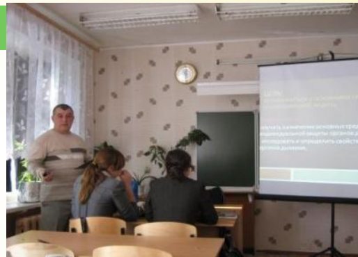
Мастер класс для преподавателей-организаторов ОБЖ (2011г)