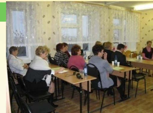
Обобщение опыта работы на научно-практической конференции среди учителей школьного округа (2009;2010г)