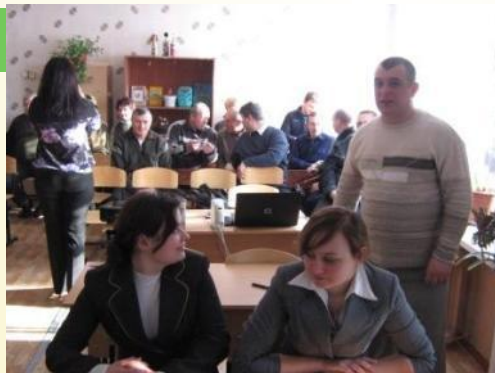
Выступление на районном семинаре преподавателей-организаторов ОБЖ (2011г)