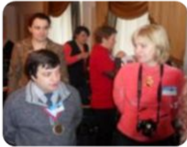
Анализ и обсуждение работы