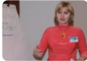
Лекция участника Обобщение опыта