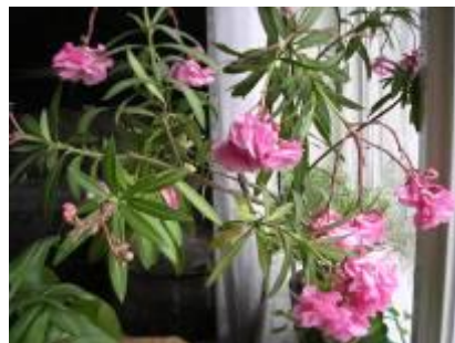
Цветет роскошный олеандр!

Уютно чувствуют себя цветы, расположившись между компьютерами и на подоконниках в кабинетах информатики, радуя нас сочными красками зимой и летом.