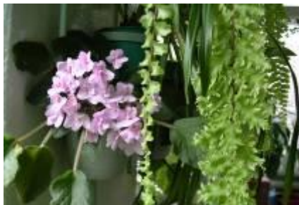
Как в тропиках!

Хлорофитум прекрасно очищает воздух и украшает кабинет