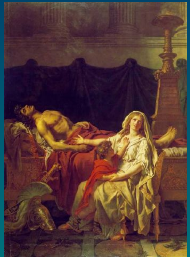
Андромаха оплакивает Гектора

Дочь Этиона, царя Фив и Киликии. Супруга Гектора. В "Илиаде" Андромаха - воплощение идеала преданной и любящей жены. Из Трои в качестве добычи была увезена Неоптолемом, от которого родила Молосса. После смерти Неоптолема стала женой Гелена, родного брата Гектора, и основала с ним новую Трою.