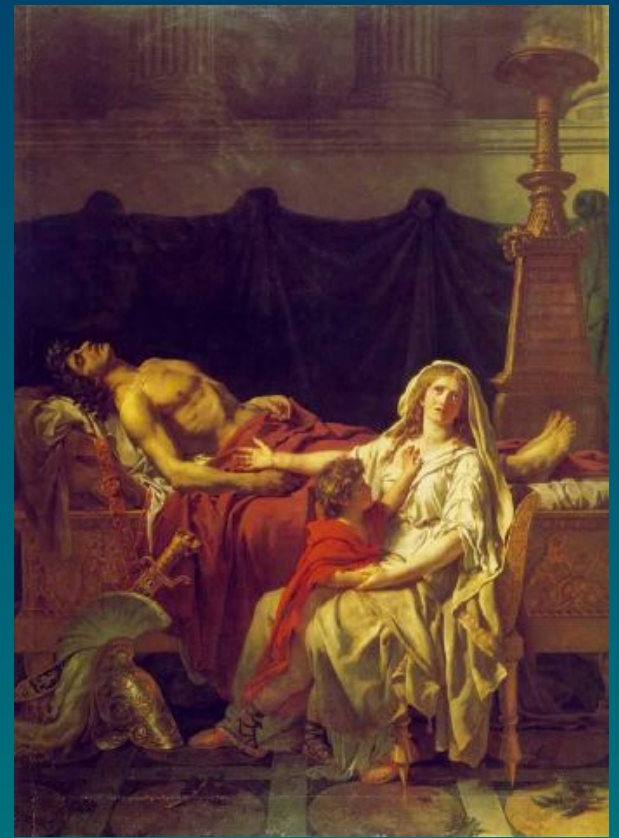
Андромаха оплакивает Гектора

Дочь Этиона, царя Фив и Киликии. Супруга Гектора. В "Илиаде" Андромаха - воплощение идеала преданной и любящей жены. Из Трои в качестве добычи была увезена Неоптолемом, от которого родила Молосса. После смерти Неоптолема стала женой Гелена, родного брата Гектора, и основала с ним новую Трою.