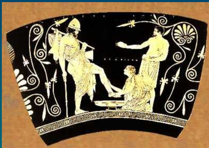
Фрагмент росписи древнегреческой вазы