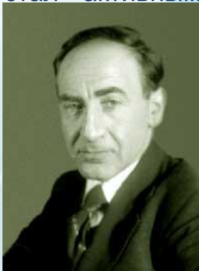
Исаак Семенович Брук (1902-1974)

своими вычислениями молодой инженером Баширом Рамеевым он представил проект автоматической вычислительной машины. В октябре того же года ими были представлены детально проработанные предложения по организации в Академии наук лаборатории для разработки и строительства цифровой вычислительной машины.