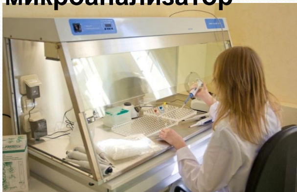
Центр медицинских биотехнологий