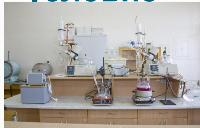
Лаборатория химических методов анализа