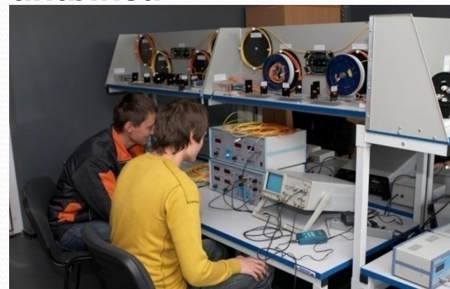
Лаборатория телекоммуникационных систем и сетей