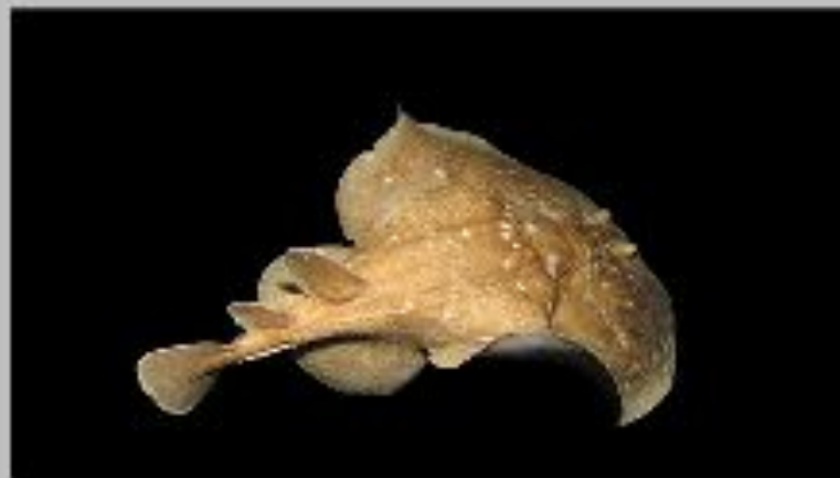
Леопардовый электрический скат