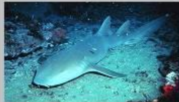
Усатая акула - нянька