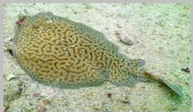
Мраморный электрический скат