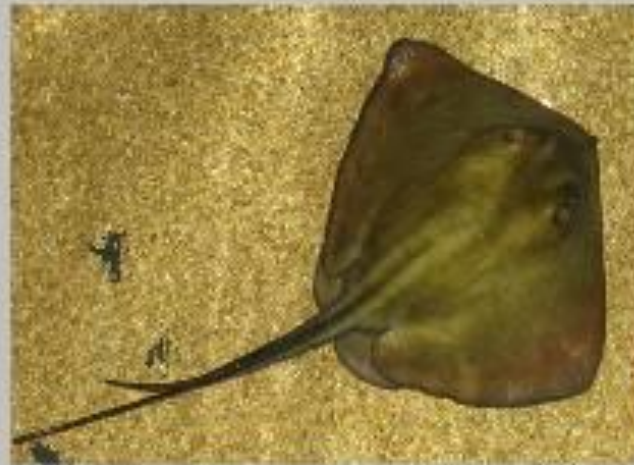
Скат хвостокол Морской кот