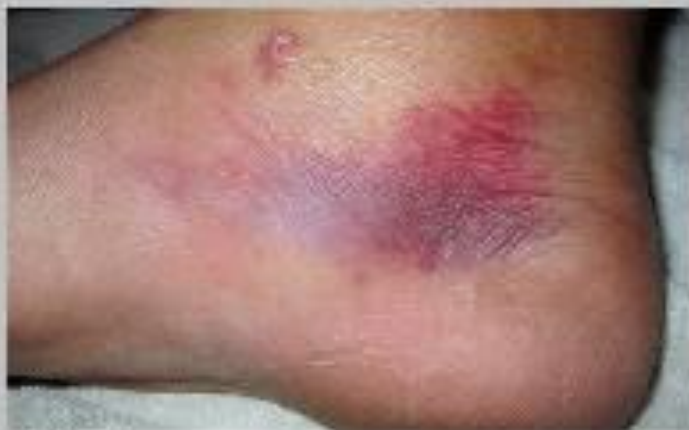
Ожоги от столкновения с электрическим скатом