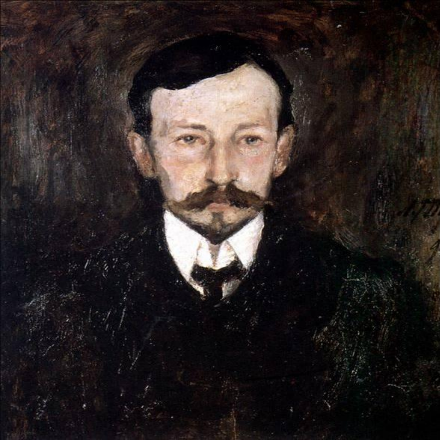
Иван Алексеевич Бунин