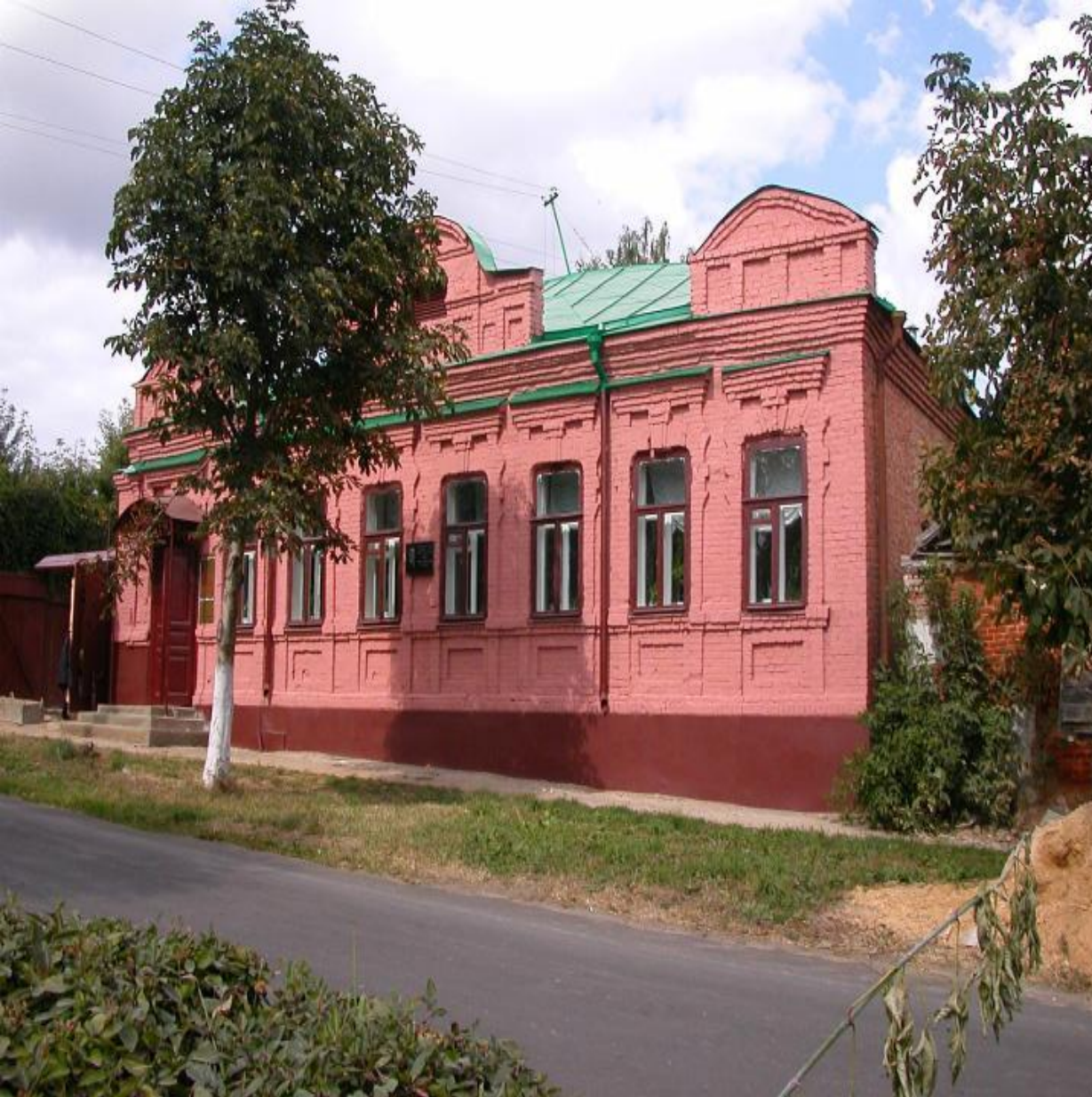
Дом – музей Ивана Бунина в городе Елец.