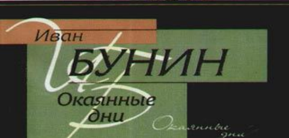
Дневник «Окаянные дни»

перебирается из большевистской Москвы в занятую германскими войсками Одессу. В феврале 1920 при подходе большевиков покидает Россию. Эмигрирует во Францию. В течение этих лет ведёт дневник «Окаянные дни», частично утерянный, поразивший современников точностью языка и страстной ненавистью к большевикам. В эмиграции вёл активную общественно-политическую деятельность: выступал с лекциями, сотрудничал с русскими политическими партиями и организациями (консервативного и националистического направления), регулярно печатал публицистические статьи. Выступил со знаменитым манифестом о задачах Русского Зарубежья относительно России и большевизма: «Миссия Русской эмиграции». Перевод Небодеворской