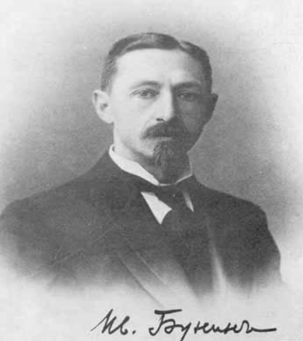
Фотография Ивана Бунина с его автографом.

ПРОБЛЕМА СВЕТЛОЙ ВИДЕ «ЖАННЕТТ» В ГРАСЕ (ДЕПАРТАМЕНТ ПРИМОРСКИ Е АЛЬПЫ). БУНИН ОТКАЗЫВАЛСЯ ОТ ЛЮБЫХ ФОРМ СОТРУДНИЧЕСТВА С НАЦИСТСКИМИ ОККУПАНТАМИ И СТАРАЛСЯ ПОСТОЯННО СЛЕДИТЬ ЗА СОБЫТИЯМИ В РОССИИ. В 1945 БУНИНЫ ВЕРНУЛИСЬ В ПАРИЖ. БУНИН НЕОДНОКРАТНО ВЫРАЖАЛ ЖЕЛАНИЕ ВОЗВРАТИТЬСЯ В РОССИЮ, «ВЕЛИКОДУШНОЙ МЕРОЙ» НАЗВАЛ В 1946 УКАЗ СОВЕТСКОГО ПРАВИТЕЛЬСТВА «О ВОССТАНОВЛЕНИИ В ГРАЖДАНСТВЕ СССР ПОДДАННЫХ БЫВШЕЙ РОССИЙСКОЙ ИМПЕРИИ...», НО ПОСТАНОВЛЕНИЕ ЖДАНОВА О ЖУРНАЛАХ «ЗВЕЗДА» И «ЛЕНИНГРАД» (1946), РАСТОПТАВШЕЕ А. АХМАТОВУ И М. ЗОЩЕНКО, ПРИВЕЛО К ТОМУ, ЧТО БУНИН НАВСЕГДА ОТКАЗАЛСЯ ОТ НАМЕРЕНИЯ ВЕРНУТЬСЯ НА РОДИНУ. МНОГО И ПЛОДОТВОРНО ЗАНИМАЛСЯ ЛИТЕРАТУРНОЙ ДЕЯТЕЛЬНОСТЬЮ, СТАВ ОДНОЙ ИЗ ГЛАВНЫХ ФИГУР РУССКОГО ЗАРУБЕЖЬЯ.