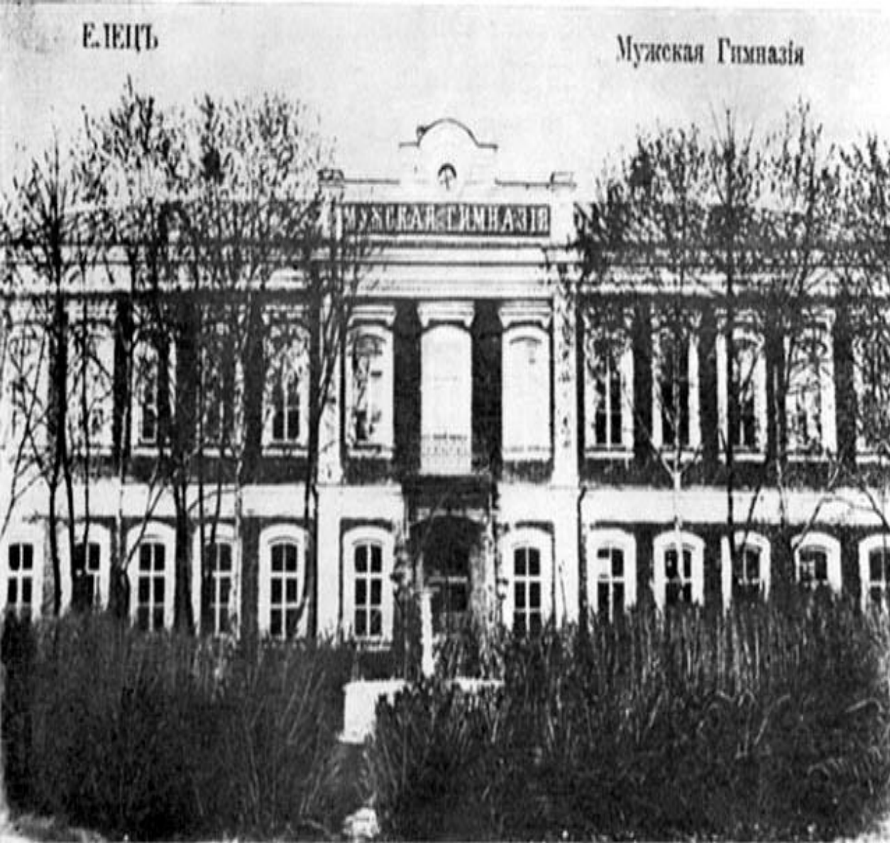
Мужская гимназия в городе Елец, в которой учился Иван Бунин.