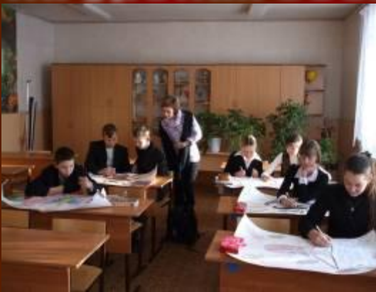
Оформление исследовательских проектов