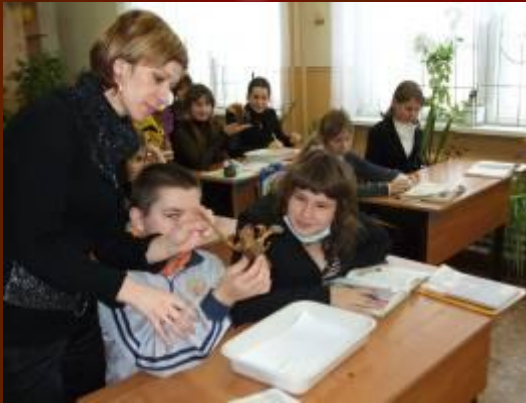
Изучение внешнего строения речного рака