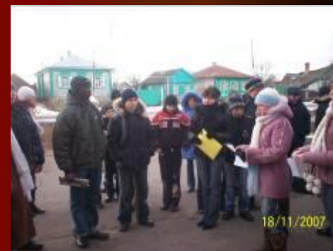
Исследование окружающей среды с. Подгорное