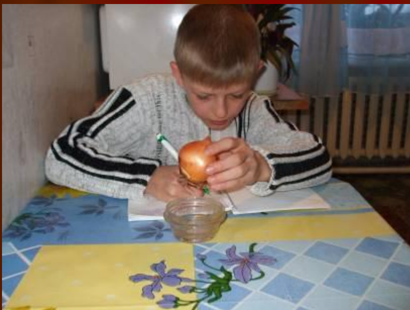
Наблюдение за ростом корней