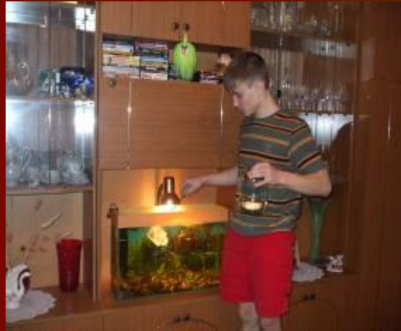
Определение зависимости интенсивности обменных процессов от температуры окружающей среды на примере аквариумной рыбки