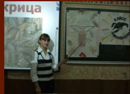
Защита исследовательского проекта «Насекомые»