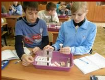
Изучение почвы с УОХ «Радуга»