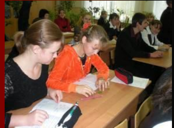
Измерение параметров листьев берез для определения экологического состояния села Подгорное