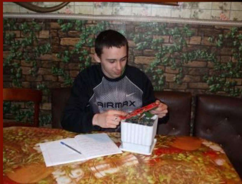
Определение модификационной изменчивости на примере комнатных растений