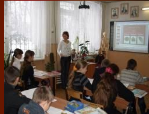
Строение и функции зеленого листа