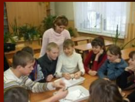
Выявление особенностей строения рыб, связанных со средой обитания