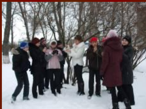
Изучение состояния деревьев школьного парка в зимний период