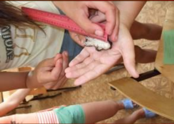
Определение возраста лягушек по пропорциям тела