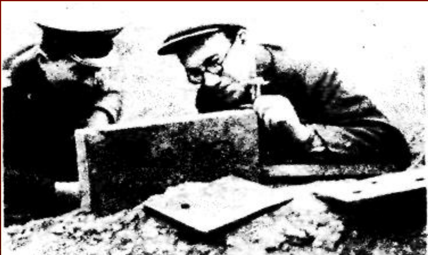
Академик М.А. Лаврентев за изучением пробивного действия взрывчатых веществ 1944г.