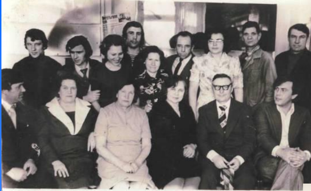
Коллектив школы в 1978 г