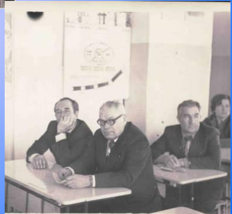
Заседание секции учителей физики