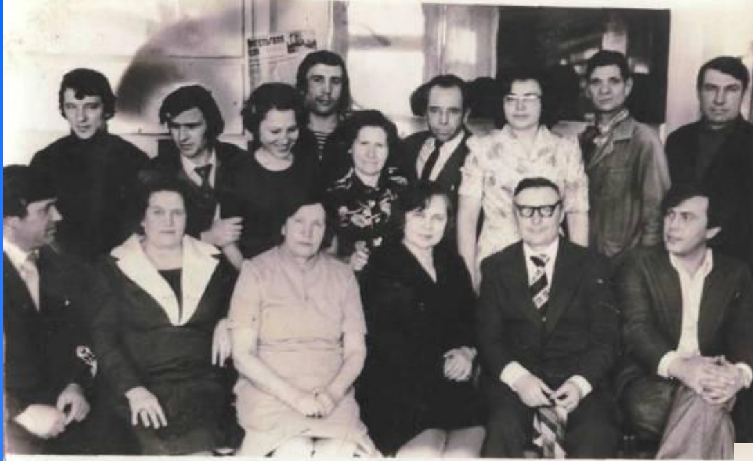
Коллектив школы в 1978 г