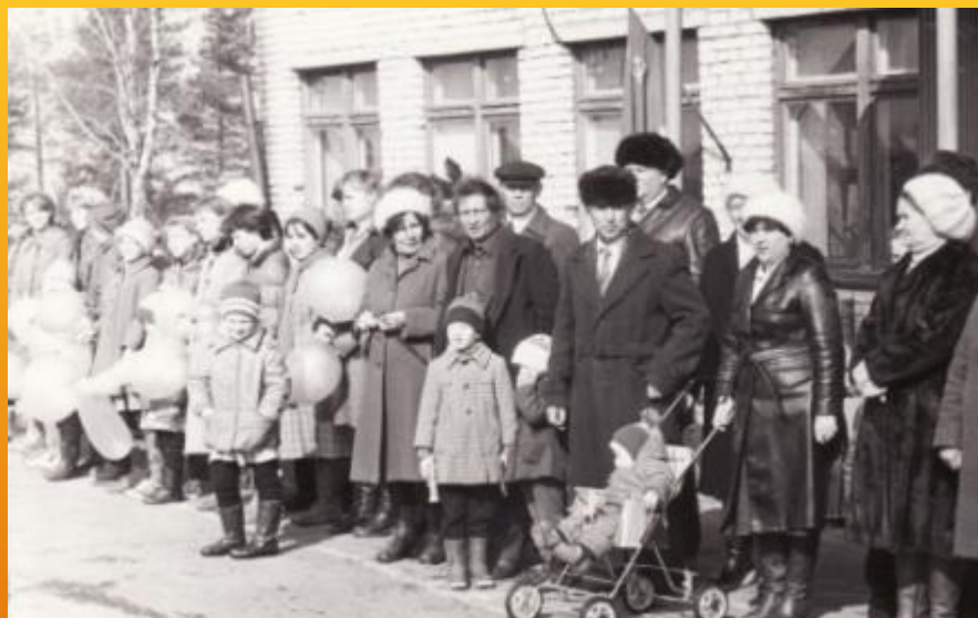
Первомайские мероприятия. 80-е гг.