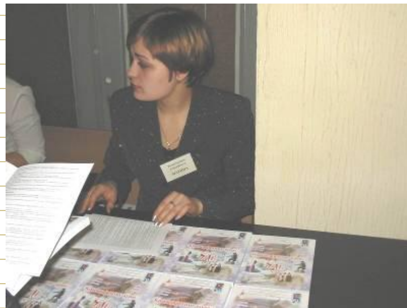
Межвузовская конференция к 70-летию края