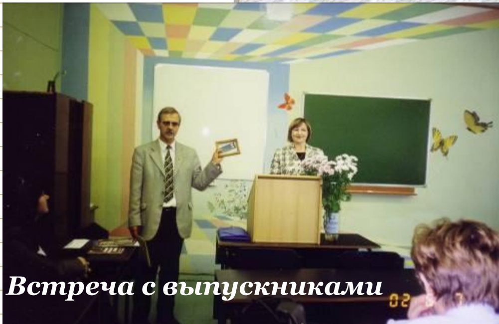
Встреча с выпускниками