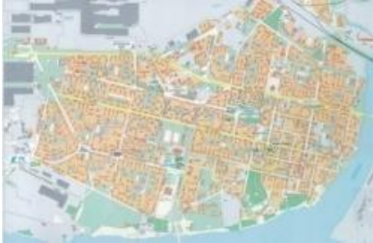
«Дорога к дому» г. Череповец (с 2006 г.)