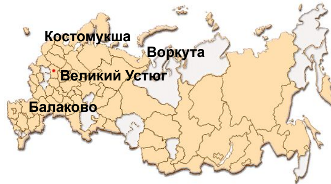
Долгосрочная целевая программа Вологодской области «Дорога к дому» (2009-2012 г.г.)