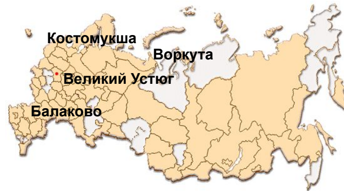
Долгосрочная целевая программа Вологодской области «Дорога к дому» (2009-2012 г.г.)