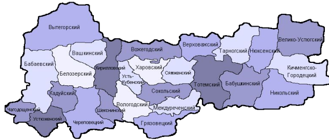
Проекты в регионах присутствия ОАО «Северсталь» (с 2011 г.)