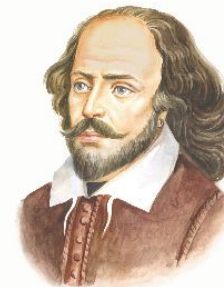
William SHAKESPEARE 1564-1616