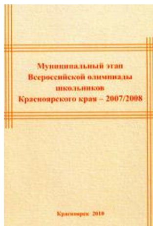
Муниципальный этап 2007/2008 год