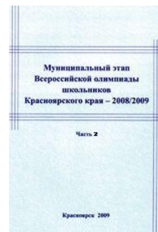
Муниципальный этап 2008/2009 год – ч.2