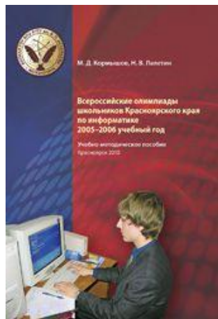
Информатик а 2005/2006 год