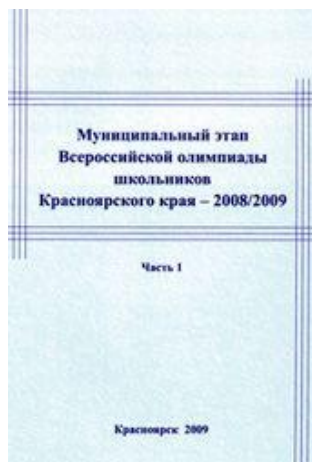
Муниципальный этап 2008/2009 год – ч.1