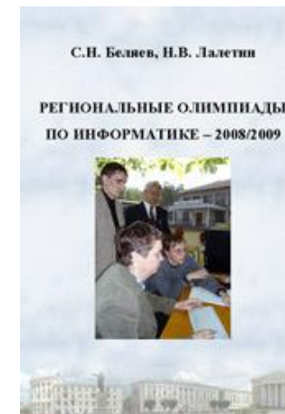
Информатик а 2008/2009 год