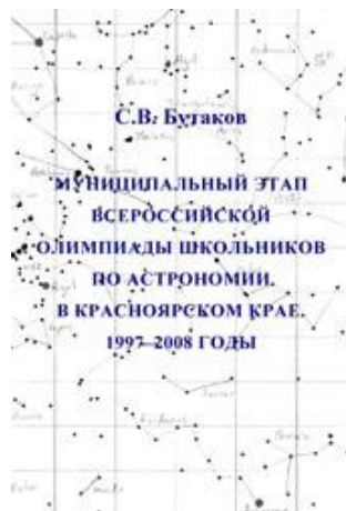
Астрономия 1997/2008 год