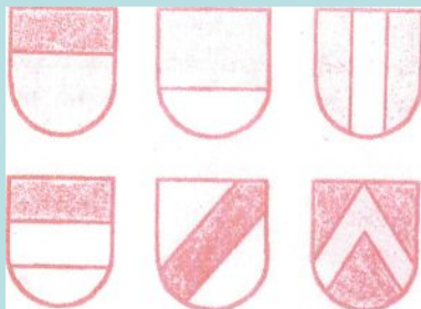
Основные геральдические фигуры