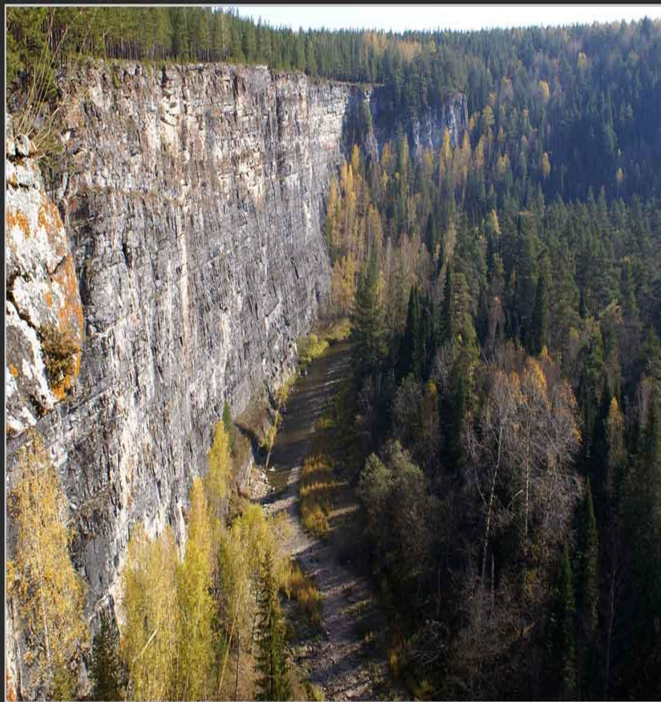
Южный Урал, р.Сим