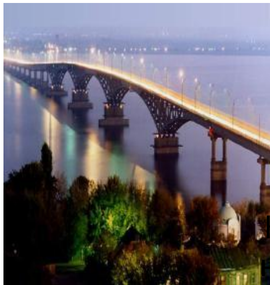
Самый длинный в России Мост через Волгу в Саратове