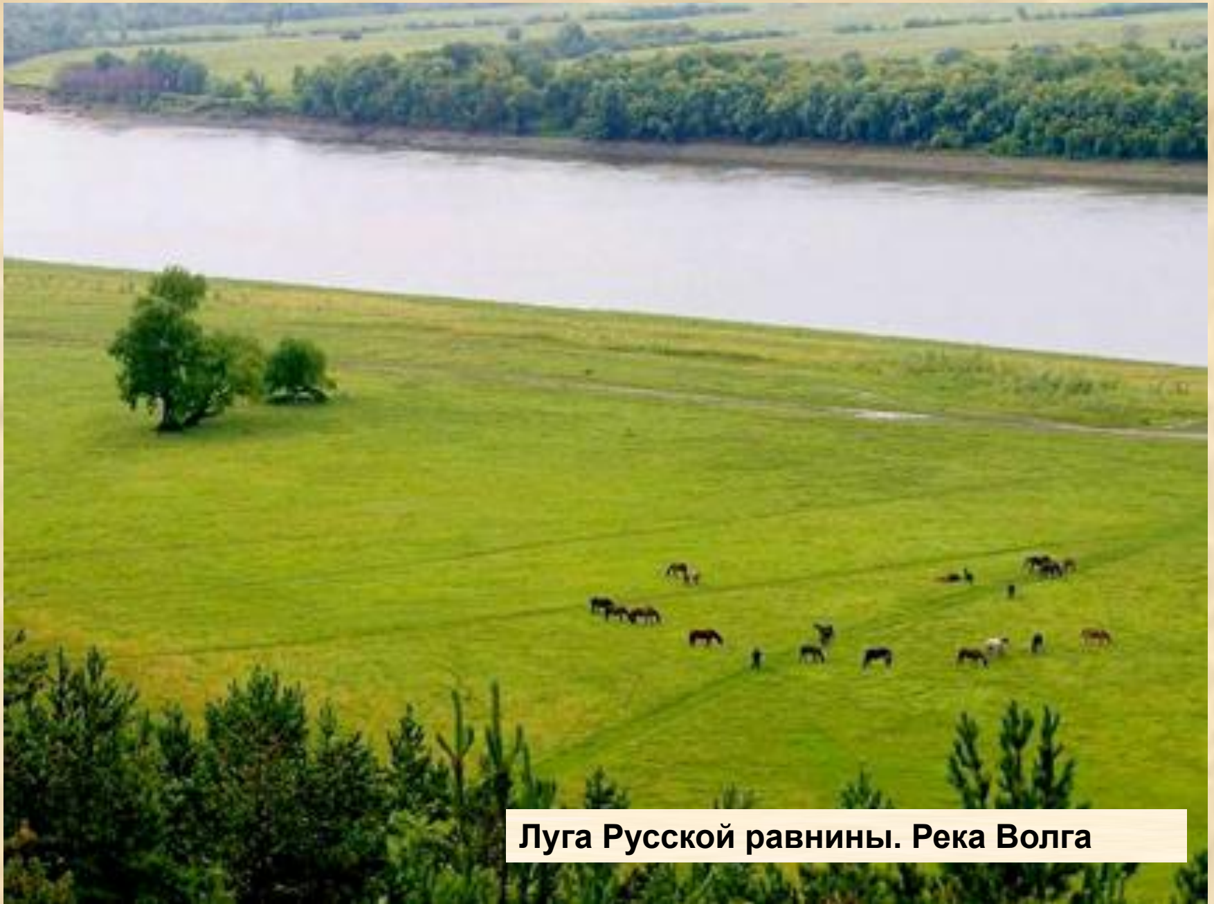
Луга Русской равнины. Река Волга