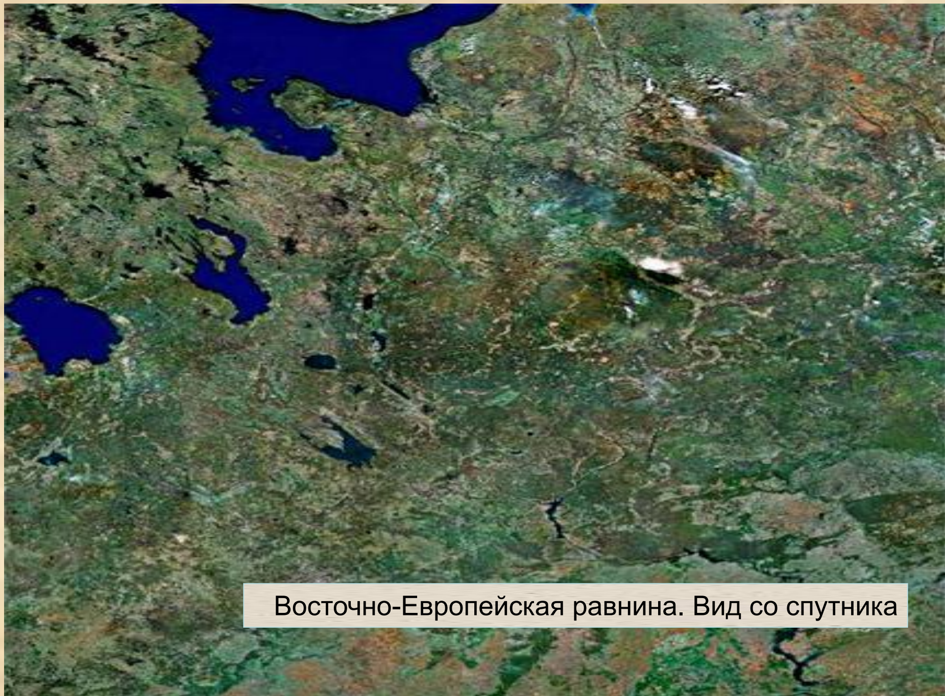
Восточно-Европейская равнина. Вид со спутника