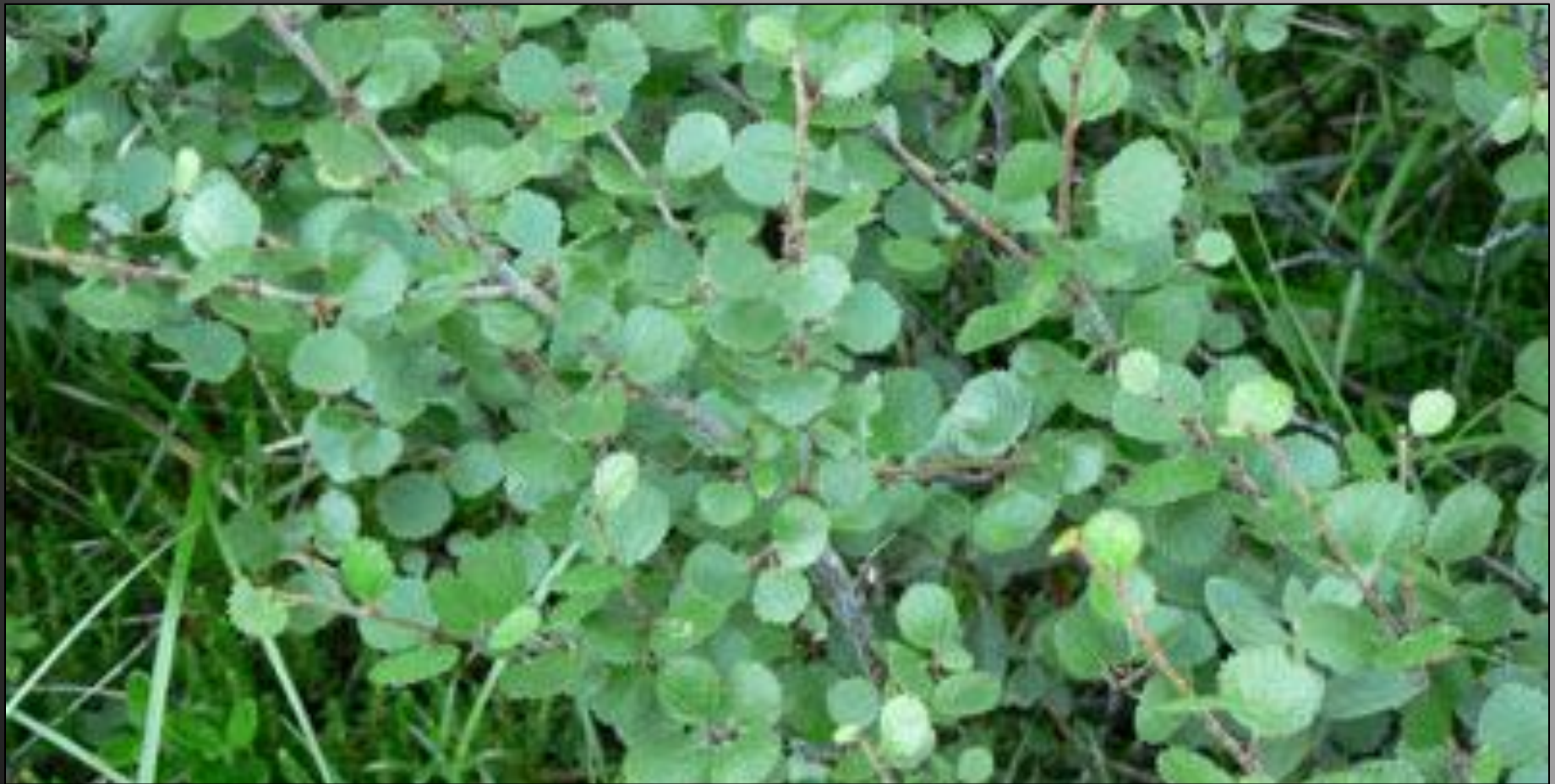
Карликовая берёза >>