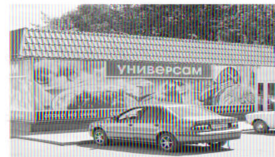
г. Ожерелье, ул. Стадионная 1