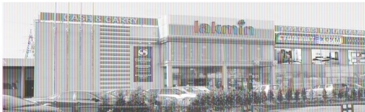
г. Тула, ул. Галицына 1д