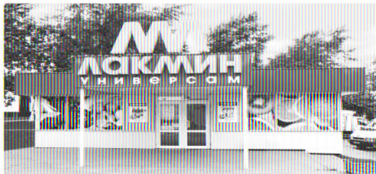
г. Ступино, ул. Пушкина 296