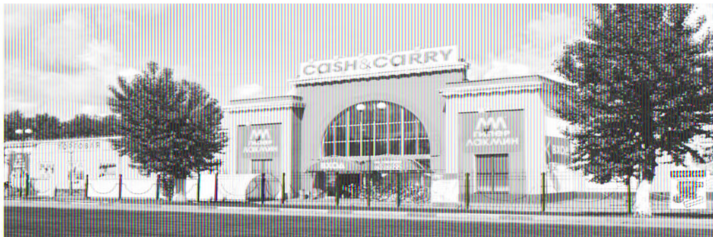
г. Ступино, ул. Пристанционная, вл.6