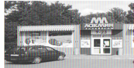
г. Ступино, ул. Калинина 23