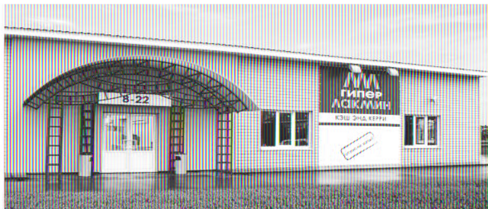
р.п. Серебряные Пруды, пл. Советская 23