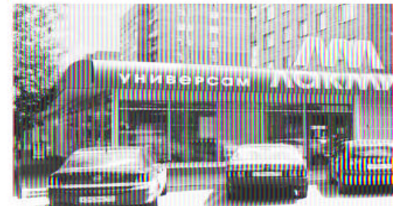
г. Ступино, ул. Андреева 1