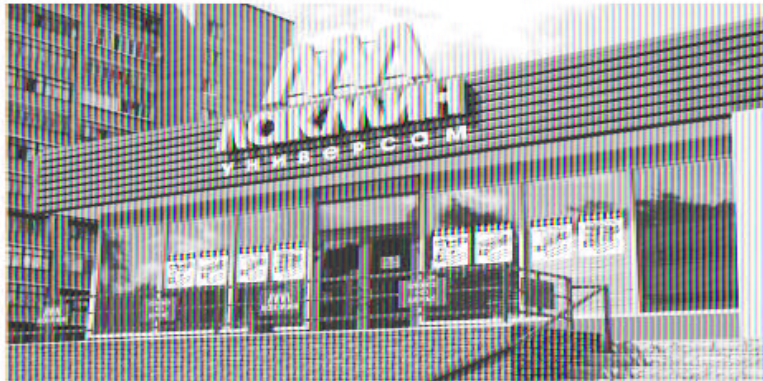
г. Ступино, ул. Службына 4