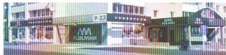
г. Ступино, ул. Калинина 46