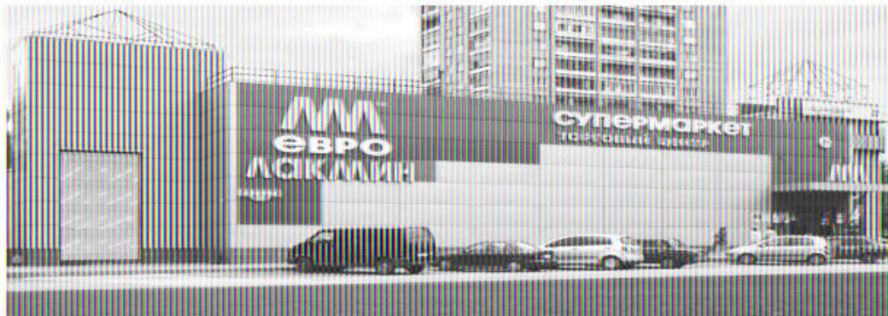
г. Ступино, ул. Барарева 17