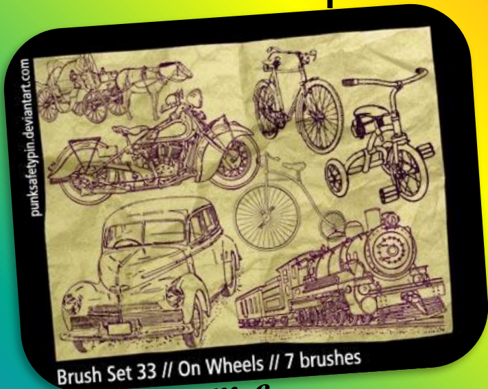
Транспорт в древнейшие времена