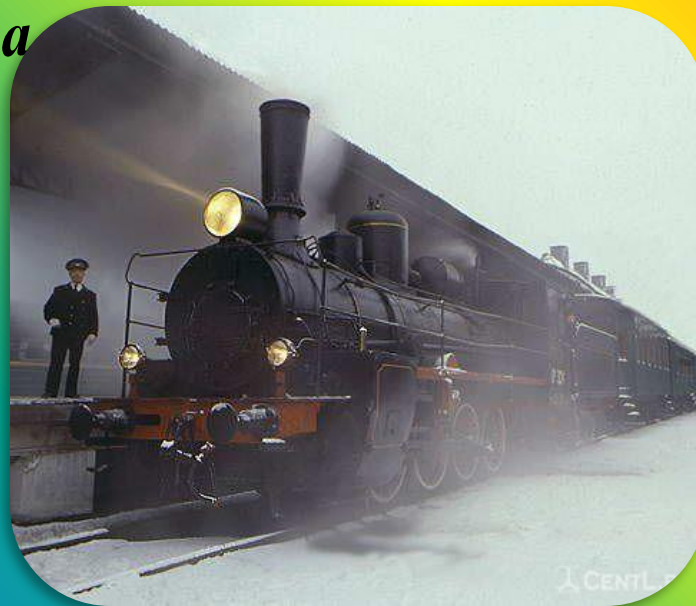
Транспорт в эпоху промышленного переворота