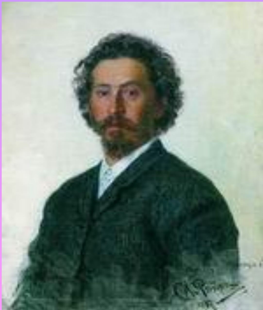
И. Е. Репин. Автопортрет. 1887 г.