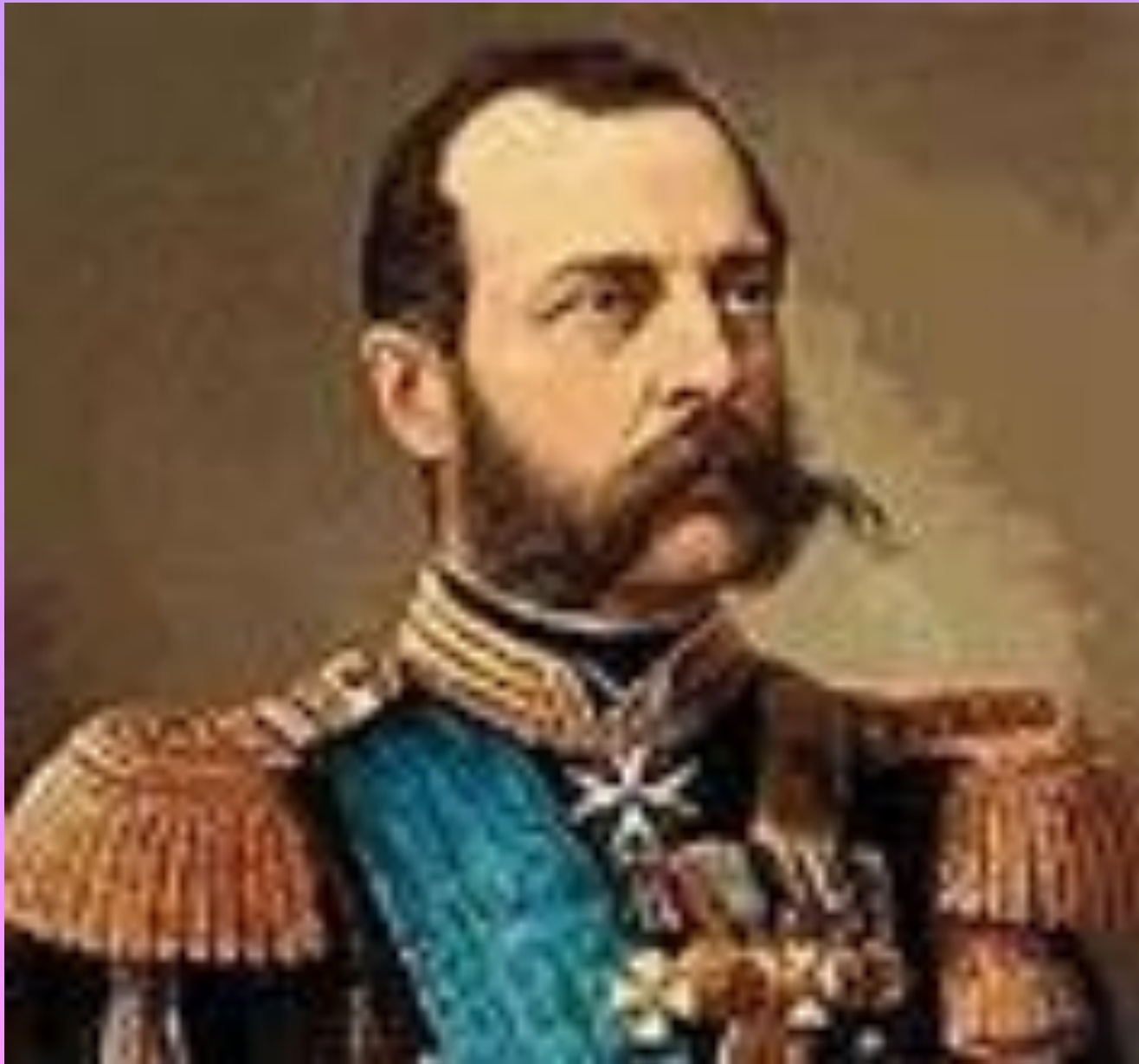
Император Александр II