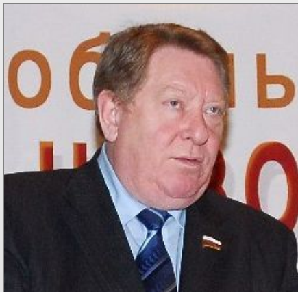
Н.Ф.Пожитков, Член Совета Федерации Федерального Собрания РФ

Совета Федерации Федерального Собрания РФ