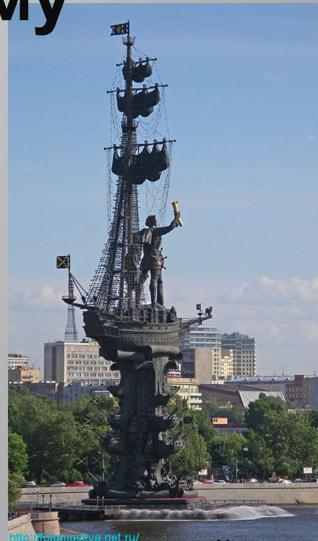
300 -летию российского флота