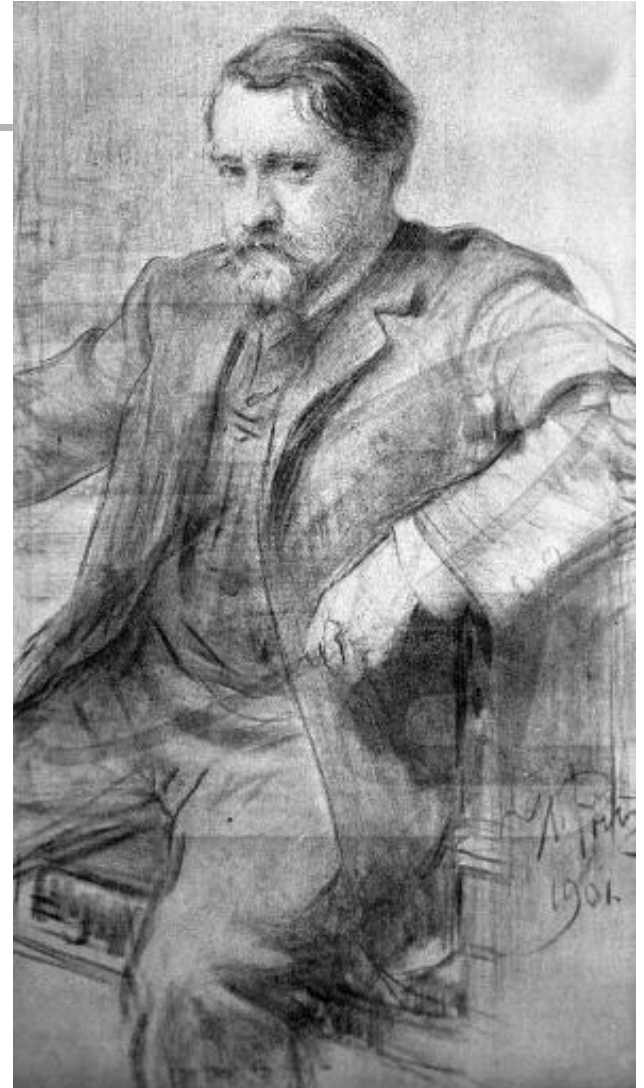
В.А.Серов Автопортрет, 1880-е годы