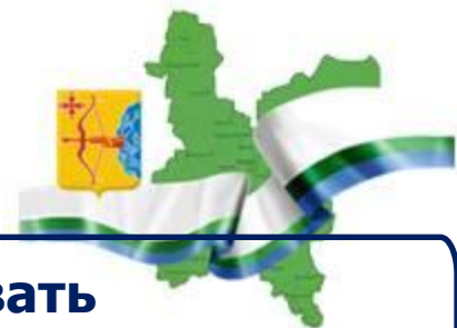
График реализации ППМИ-2013