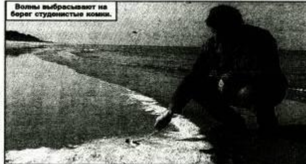
Волны выбрасывают на берег студенистые комки.

После получасовых поисков изобрели на лагуну, отделенную от прибоя узкой полосой песка. На дне ясно просматривались подозрительный осадок. Зеленовато-серого цвета! Да и пеня на поверхности лужи тоже показалась какой-то злощестей. Немного смутная резининиса в воде мальки. Вот и все, что удалось увидеть.