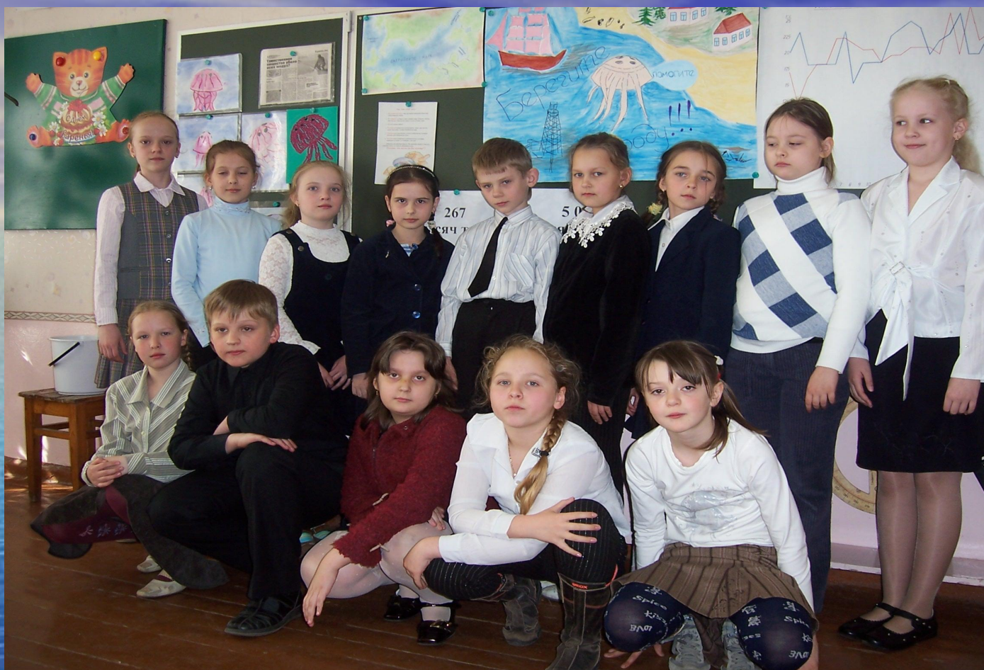
АГИТБРИГАДА 3 КЛАССА «А» МОУ СОШ №16 г. Калининграда