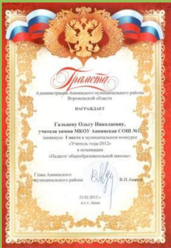
Победитель муниципального конкурса «Учитель года – 2012»