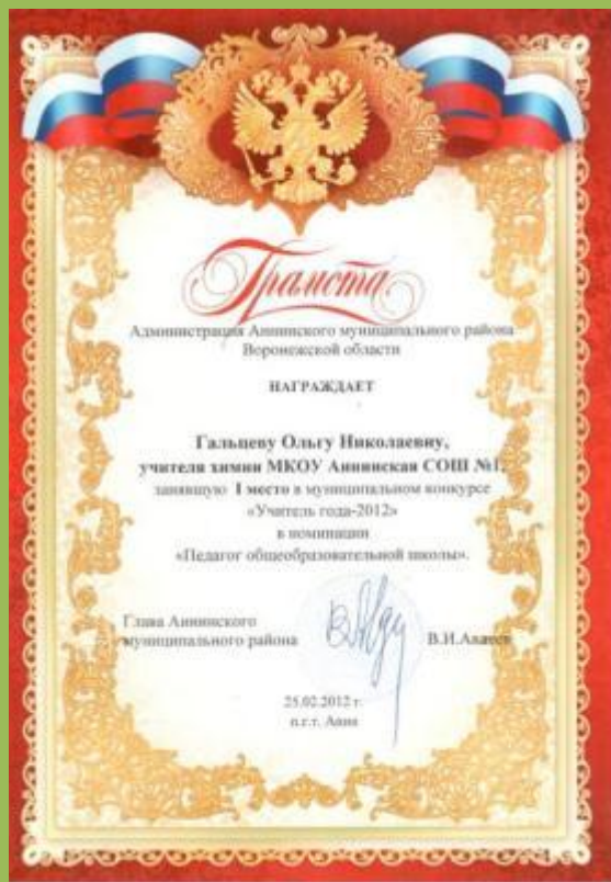
Победитель муниципального конкурса «Учитель года – 2012»