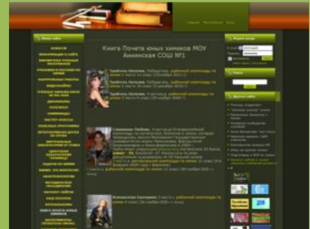
Персональный сайт «Химия24» (до 1000 посетителей в сутки)