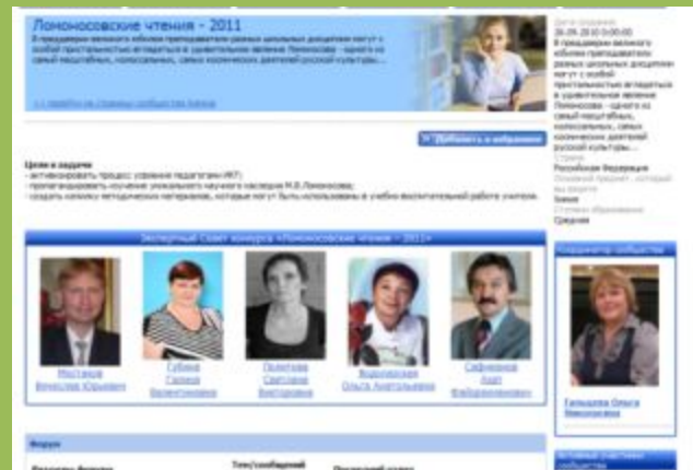
Творческая группа «Ломоносовские чтения»