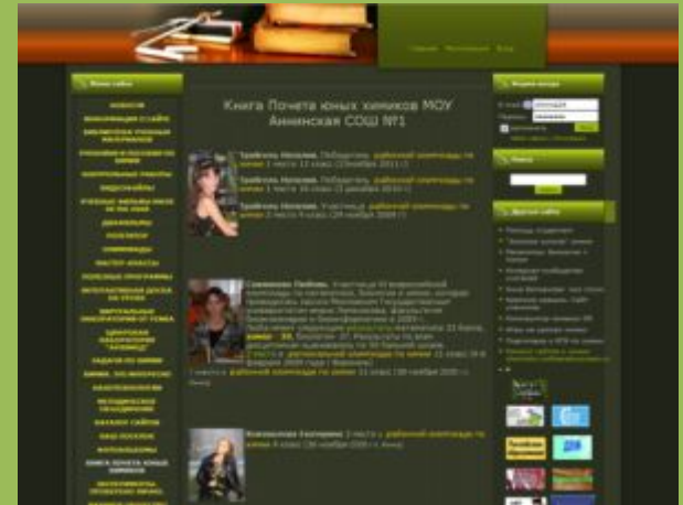
Персональный сайт «Химия24» (до 1000 посетителей в сутки)