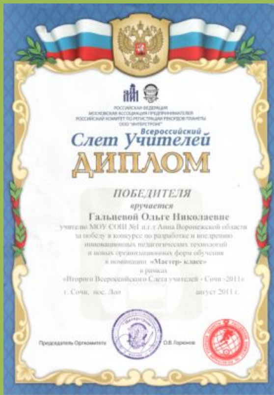
Победитель конкурса по разработке и внедрению инновационных педагогических технологий в