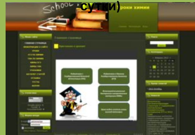
Сайт для дистанционных уроков