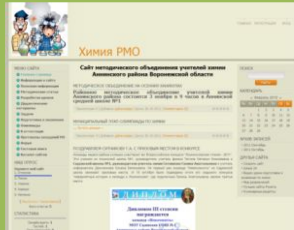
Сайт методического объединения учителей химии Аннинского района