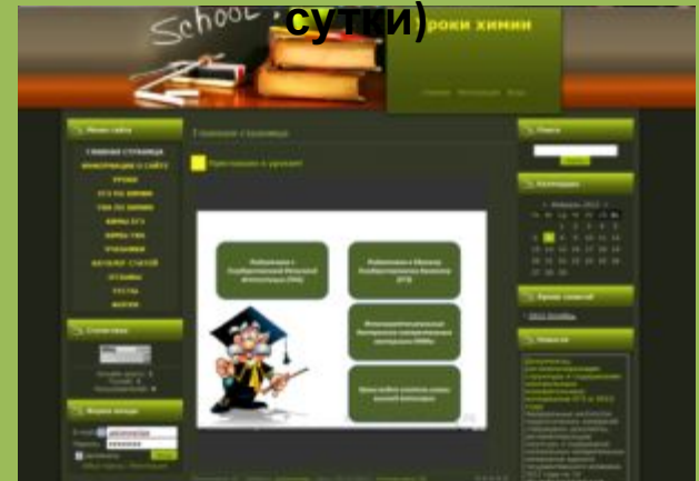
Сайт для дистанционных уроков