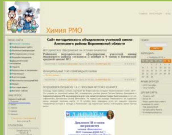
Сайт методического объединения учителей химии Аннинского района