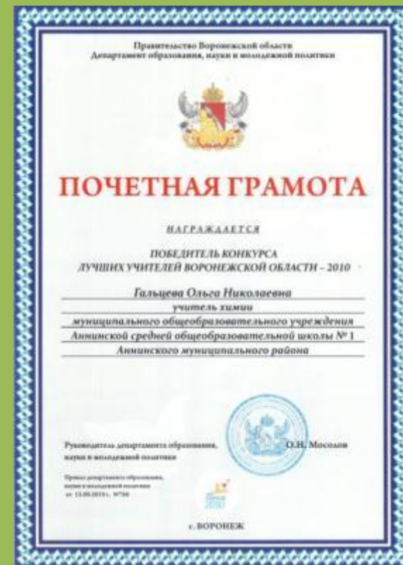
Победитель конкурса лучших учителей Воронежской области - 2010