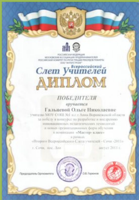
Победитель конкурса по разработке и внедрению инновационных педагогических технологий в