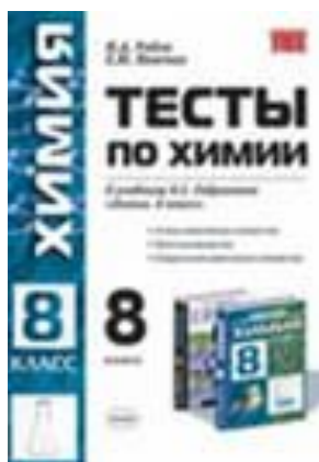
Тесты к уч. Габриеляна О.С. Атомы хим. элементов. Простые вещ.