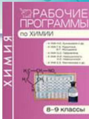
И.И. Новошинского, Н.С. Новошинской... О.С. Габриеляна (М.: Дрофа)