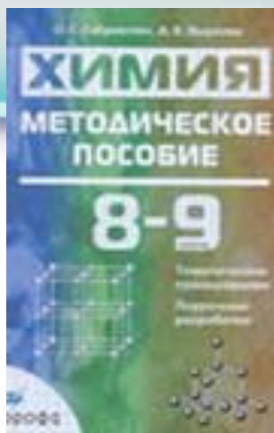
Дрофа. Поиск. 2008. Габриелян О.С. Яшукова А.В.