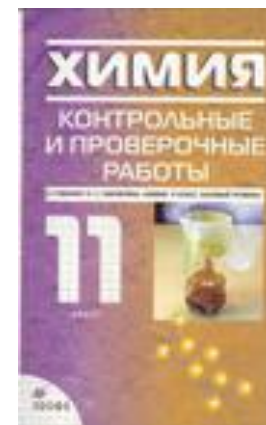
Контрольные и проверочные работы, 11 класс.