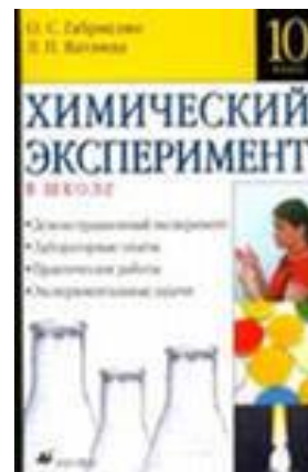
Химический эксперимент в школе 10 класс