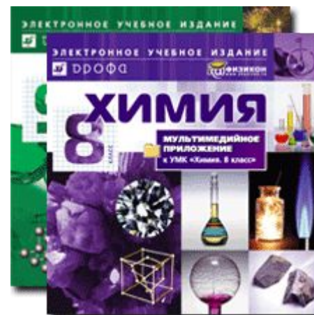
Мультимедийное приложение к учебнику О.С. Габриеляна