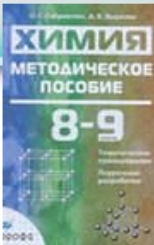
Дрофа. Поиск. 2008. Габриелян О.С. Яшукова А.В.