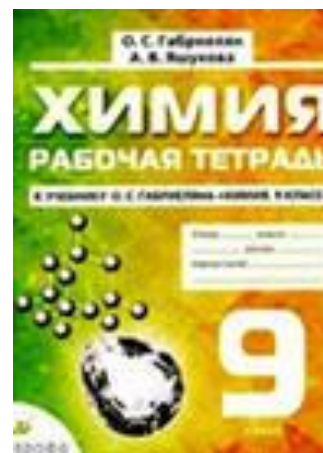
Рабочая тетрадь, 9 класс