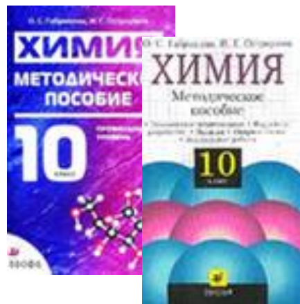
Химия 10 класс. Методическое пособие.