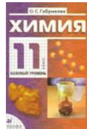
Габриелян О. С. Издатель: Дрофа.