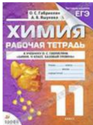
Рабочая тетрадь по химии 11 класс. Подготовка к ЕГЭ.