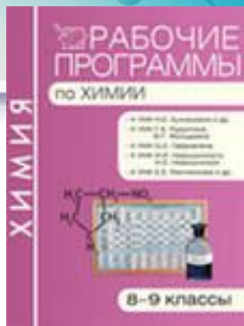
И.И. Новошинского, Н.С. Новошинской... О.С. Габриеляна (М.: Дрофа)