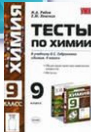
Авт. О. С. Габриелян, изд- ва 'Дрофа'.