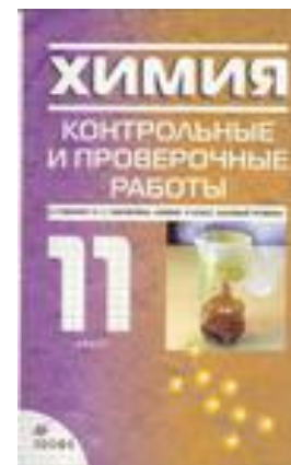
Контрольные и проверочные работы, 11 класс.