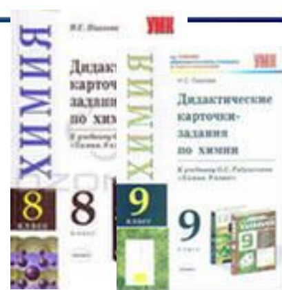
Авт. О. С. Габриелян, изд-ва 'Дрофа'.