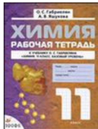
Рабочая тетрадь по химии 11 класс.