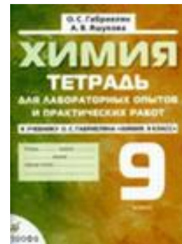
Тетрадь для лабораторных опытов и практических работ