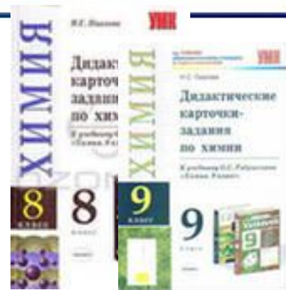
Авт. О. С. Габриелян, изд-ва 'Дрофа'.