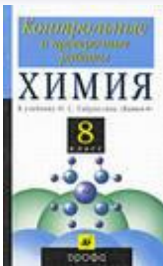
Контрольные и проверочные работы