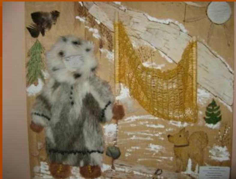
Чекусова Элина 2-е место